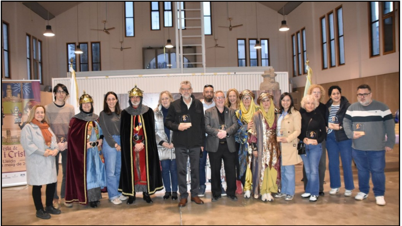
Festeres i festers que fan vint-i-cinc anys a l'Associació