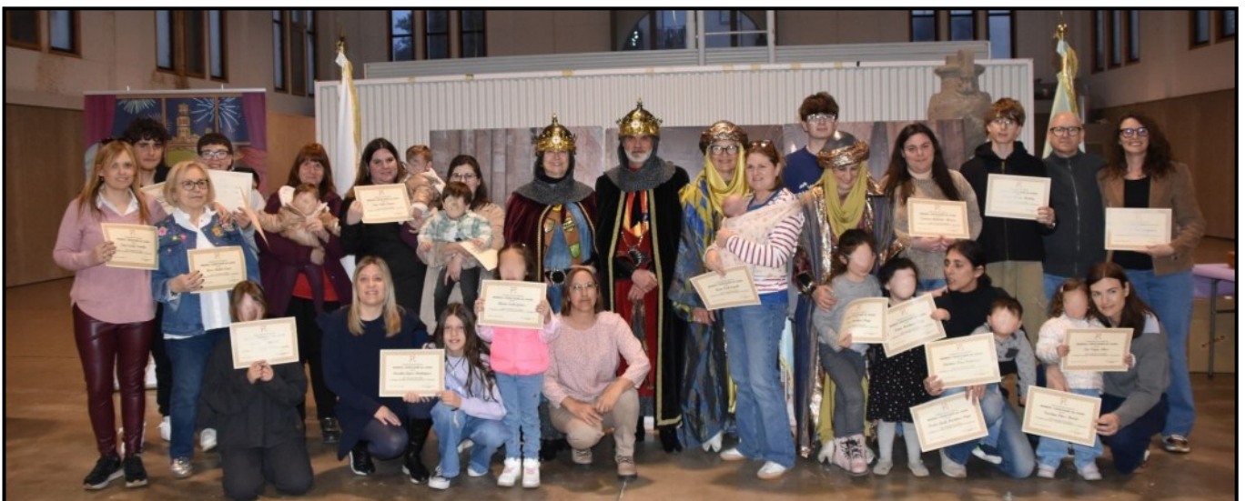
Foto de grup dels nous socis