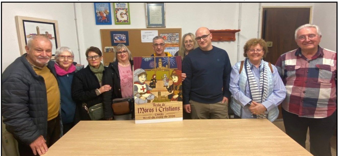
Components del jurat del XXIX Concurs de Cartells