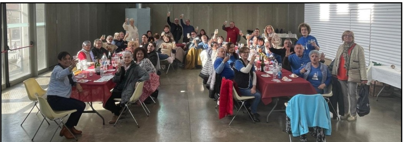
Festers assistents a la Calçotada festera