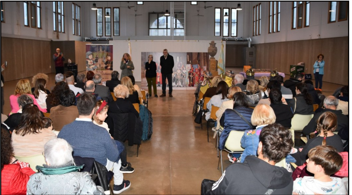
Públic assistent a l'acte de rebuda dels nous socis, homenatges i presentació del Cartell de la Festa 2026