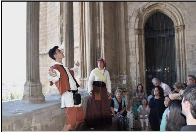
Joglars presentant l'espectacle al públic