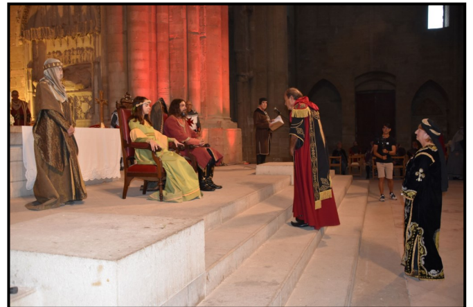
Homenatge poble musulmà