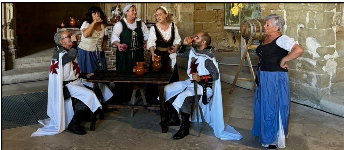
Escena a la taverna. Cortesanes i templers