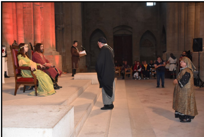
Homenatge poble jueu