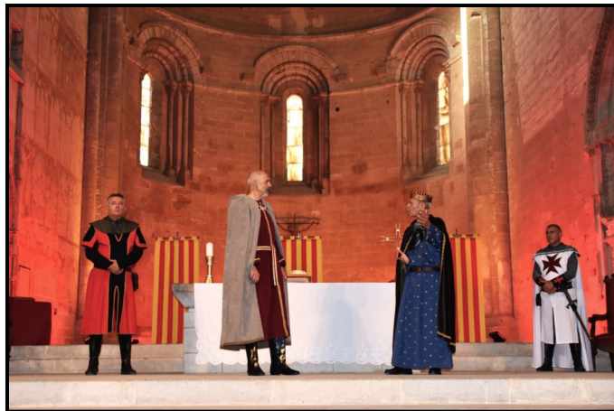
El pacte d'Alagó entre Alfons VII i Ramir II