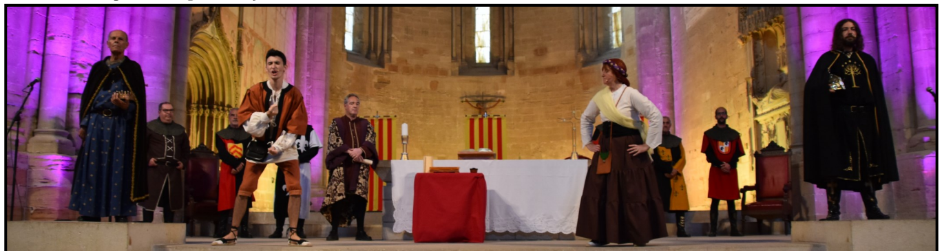
Els capítols matrimonials