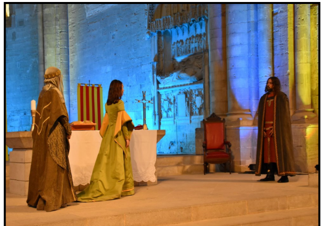
Lliurament de Peronella