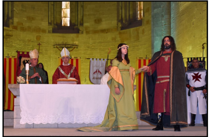
Cerimònia de casament