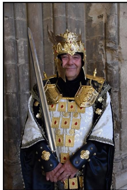
Josep Fuentes Sanjuan, Comte del bàndol cristià