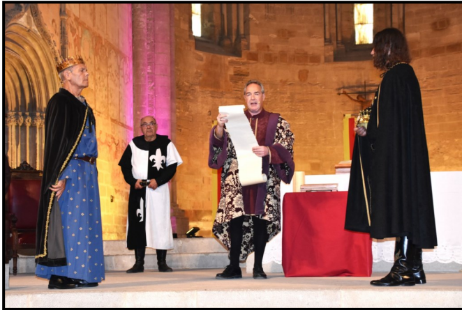
Lectura del notari als capitols matrimonials