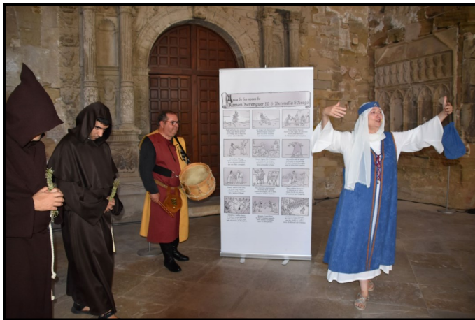
L'anca de les Noces Reials