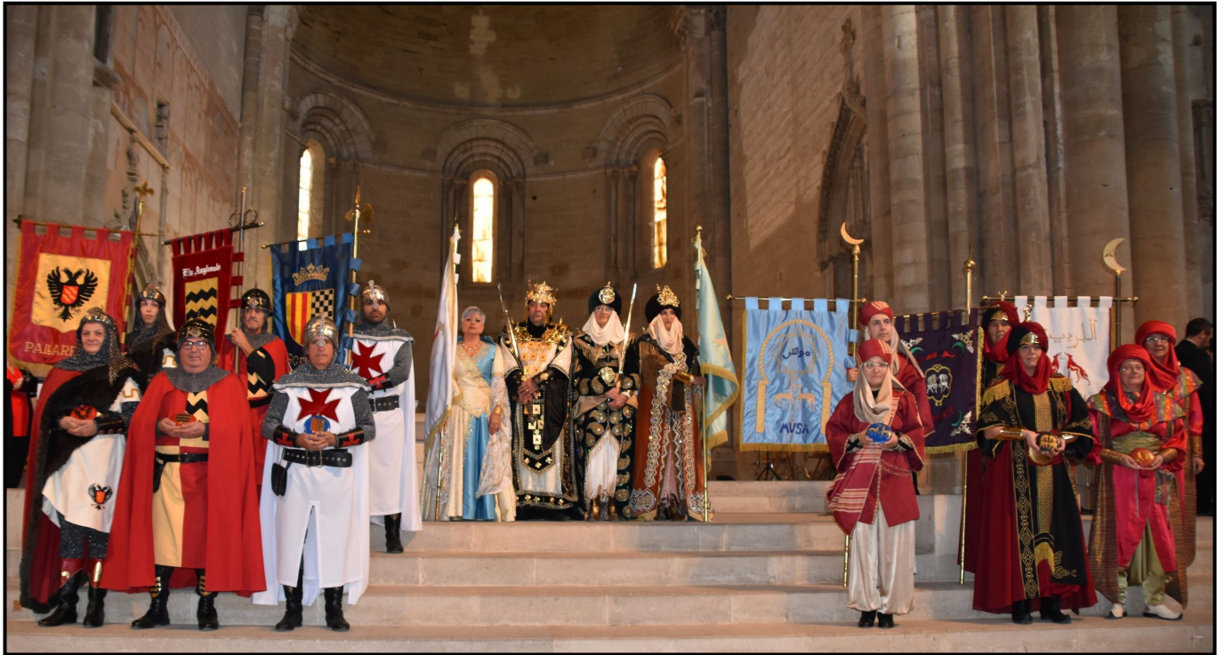
Foto de grup del nous càrrecs del bàndol moro i cristià