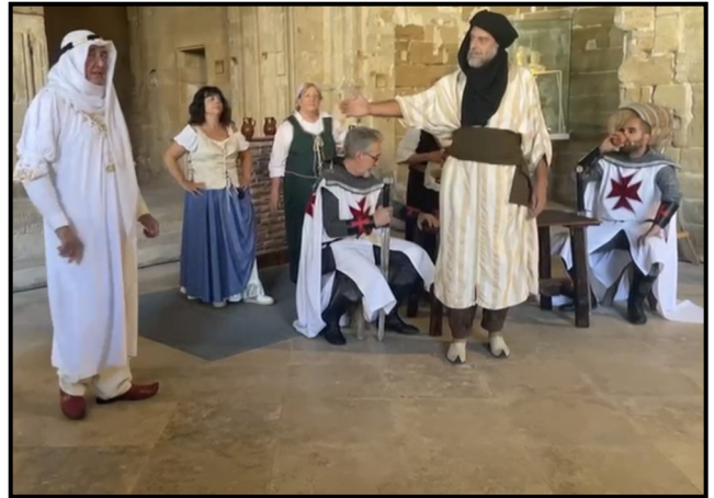
La Batalla de Fraga