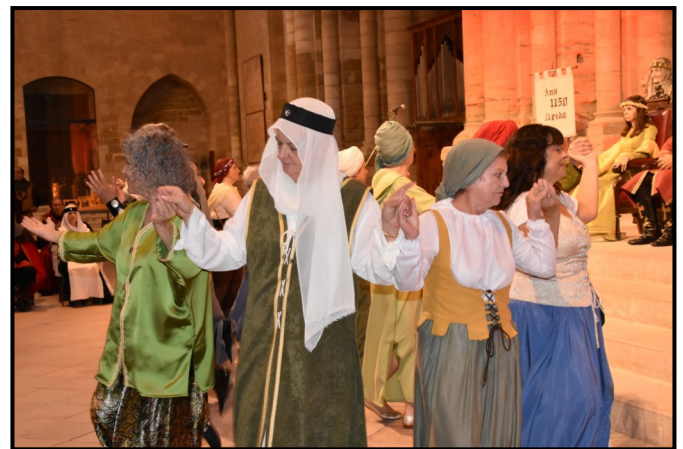
Grup de dansa als homenatges