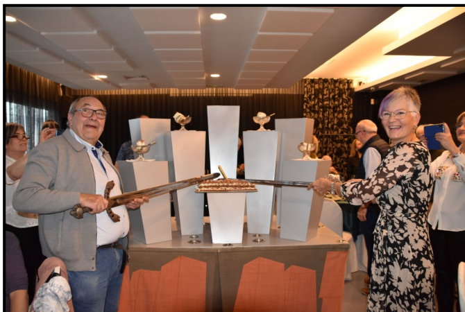
La Saïda i el Comte tallen el pastís de celebració