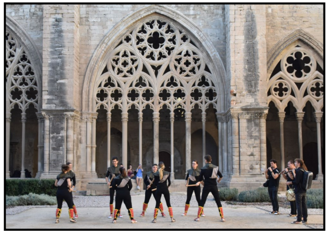
Ball de bastons