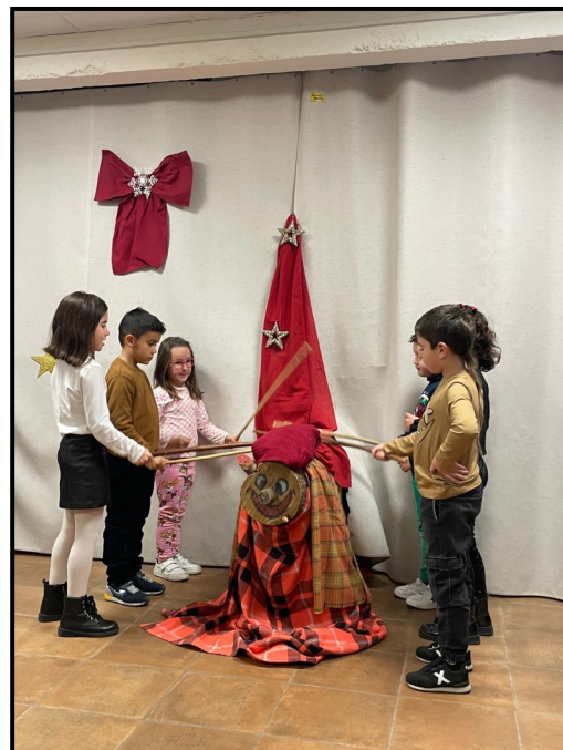
Nens i nenes de l'Associació fent cagar el tronc de Nadal