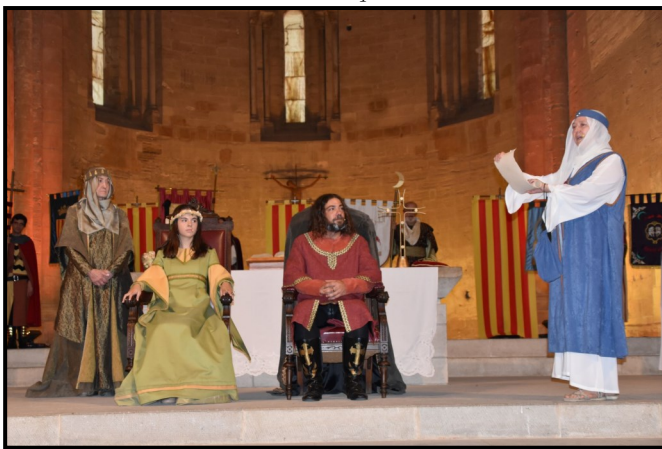
Trobairitz recitant versos