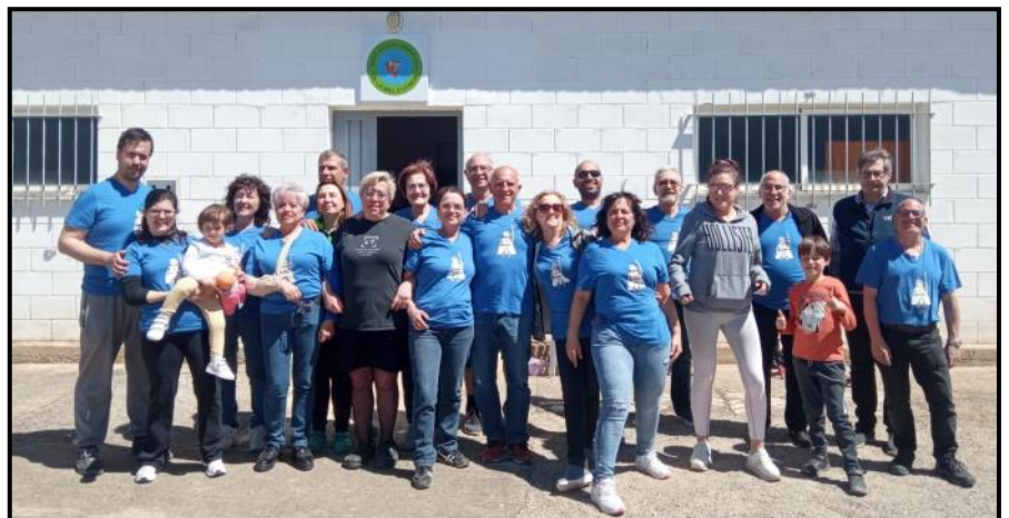
Foto de grup dels Urgellencs

Aquesta activitat, sens dubte, ajuda a enfortir el sentiment fester i tot sigui dit, a mantenir la panxa plena.