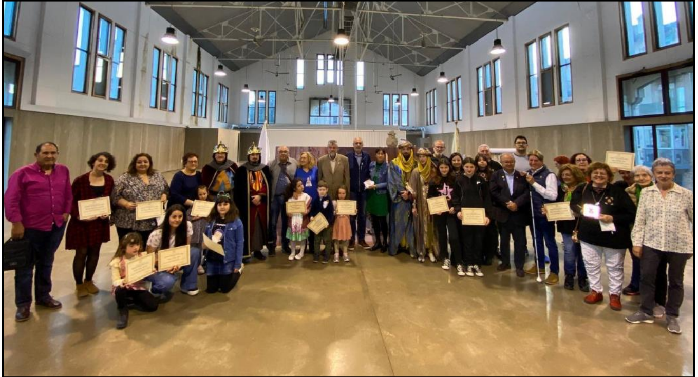
Foto de grup dels nous socis i dels festers que han complert 25 anys a l'associació

Després d'un dinar de calçotada i ball de tarda, a les 18:30 hores es va dur a terme l'acte institucional d'homenatge als socis pels seus 25 anys a l'associació, la rebuda dels nous socis i un emotiu record als membres de la Festa que ens han deixat en el darrers dos anys.