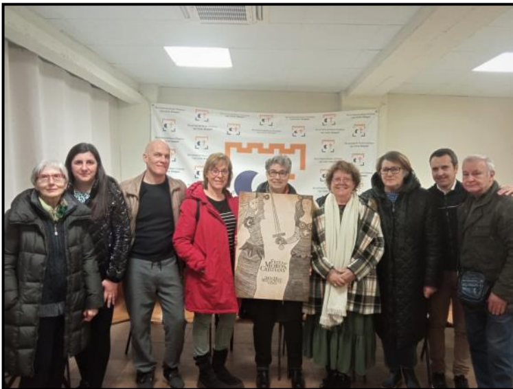
Membres del jurat del concurs de Cartells

Al concurs es van presentar un total de 32 cartells i estava dotat amb un premi de 1000 €.