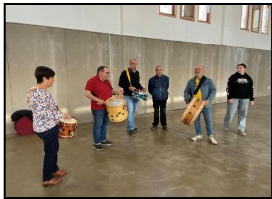
Taller de percussió