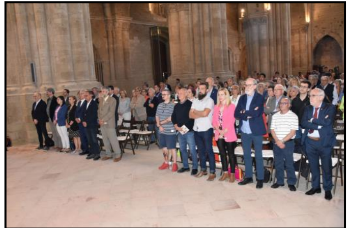
Autoritats i públic assistent a l'acte