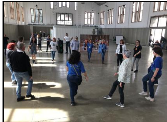
Taller de dansa