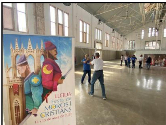
Taller de lluita