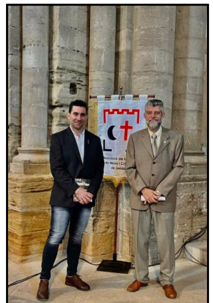
Vicepresident 3er de la UNDEF