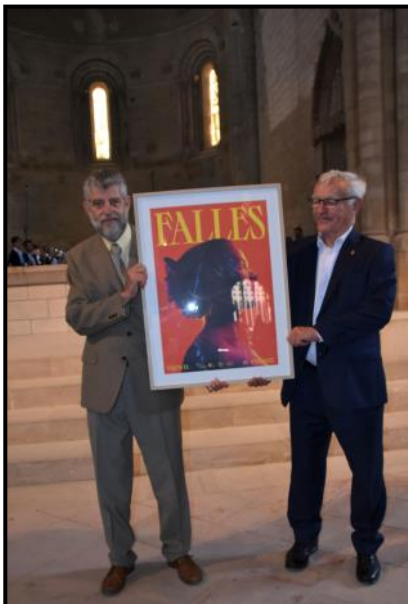
Obsequi per a l'Associació