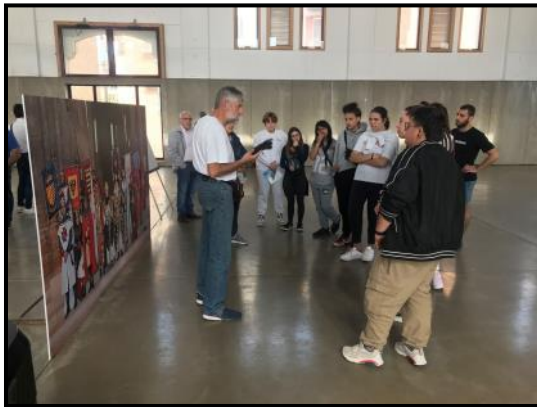
Difusió de la Festa de Moros i Cristians