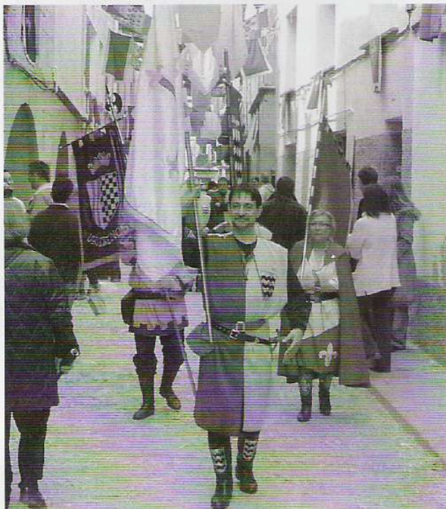
I ELS FESTERS, PELS CARRERS D'ANGLESOLA.

Com ja deveu saber, el diumenge 18 d'abril, l'Associació de la Festa de Moros i Cristians de Lleida va anar a Anglesola, convidats per l'Ajuntament d'aquesta població. Ja s'havia intentat l'any passat, però no es va poder portar a terme per manca d'algun petit detall, cosa que enguany s'ha pogut subsanar. A dos quarts de vuit del matí, i amb grans dosis d'entusiasme, l'autocar es va posar en marxa. En arribar, tothom es va prendre seriosament el muntatge de la tenda cristiana i de la haima mora, amb els dubtes de sempre: que si aquest tub és del sostre o d'un lateral, d'on diables són aquests tres cargols que m'han sobrat... La qüestió és que aviat els destres muntadors ho van tenir enllestit i es va poder esmorzar amb el convenciment del deure complert.