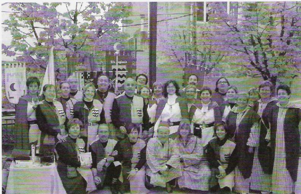
I ELS VISITANTS VAN GAUDIR D'UNA PETITA MOSTRA DE LA NOSTRA FESTA.