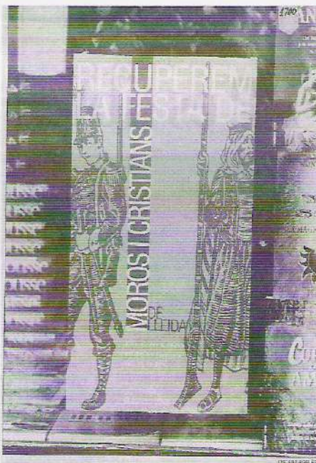
La ajuda de la Generalitat ha possibilitat "revivir" Lleida de cartelles reclamo

Miquel y que desaparecieron hace 200 años. Los vecinos quieren "resucitar" la tradición para las próximas Festes de Maig, para lo que han solicitado la colaboración del IEI y de cofradía de Alcoy y Ontenient, en Valencia.