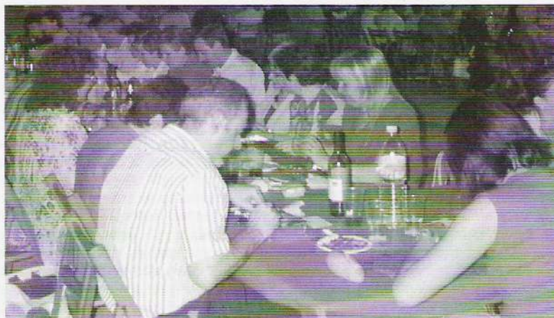
I IMATGE DEL SOPAR DE L'ANY PASSAT.

L'Associació de la Festa de Moros i Cristians de Lleida celebrarà un nou sopar de tancament d'Any Fester el proper dia 5 de juny. Per reservar plaça al sopar, els festers, familiars i amics tenen temps fins el dia 2 de juny. Les reserves es formalitzen a Confeccions Boix o Confeccions Armengol del carrer Cavallers a un preu de 15 euros.