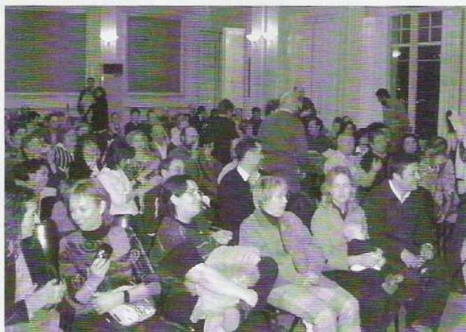
I FESTA DE BENVINGUDA ALS NOUS SOCIS, EL DIA 2 D'ABRIL.