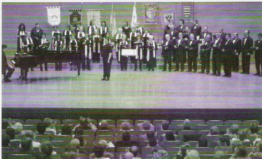
I L'ORFEÓ LLEIDATÀ VA OFERIR UN VARIAT PROGRAMA.

Amb els pendons i les xil·labes, us volem dir: fins l'any que ve.