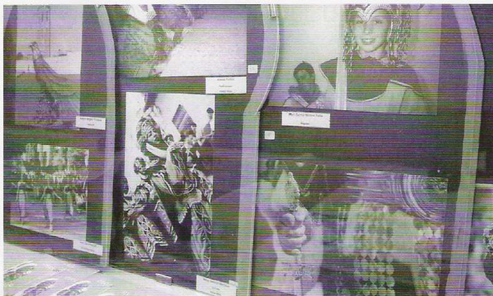
I EXPOSICIÓ DE LA FESTA A LA PENYA BARCELONISTA.