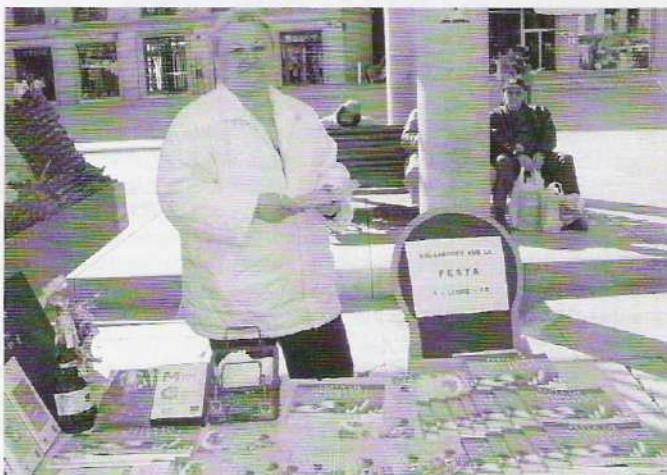
I PRESENTACIÓ DEL LLIBRE, PER SANT JORDI.