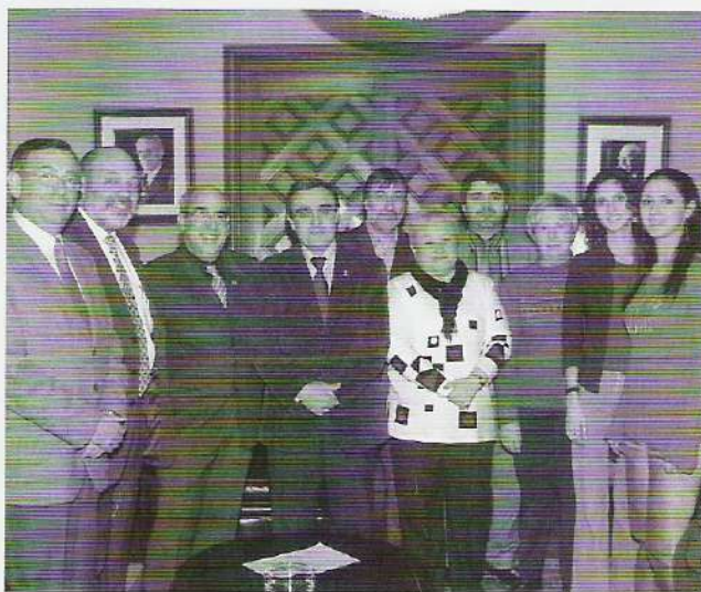
I ENTREVISTA AMB L'ALCALDE ÀNGEL ROS, EL DIA 16 DE MARÇ.