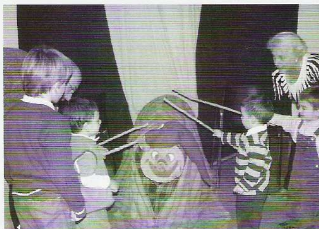
I ELS MÉS PETITS VAN FER "CAGAR" AL TIÓ AL DESEMBRE.