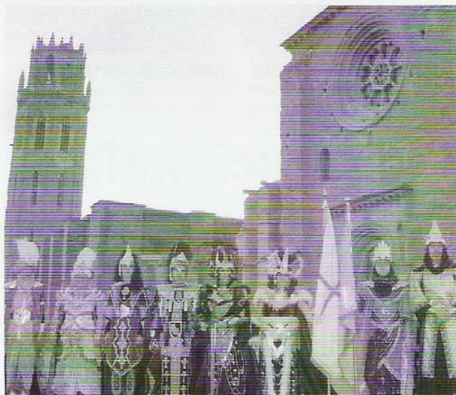
I PRESENTACIÓ DEL MIG ANY A LA SEU VELLA.