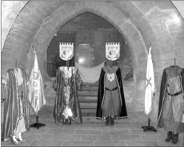
I EL MUSEU DE LA PAERIA ACULL LA MOSTRA FINS EL DIA 7 DE GENER.