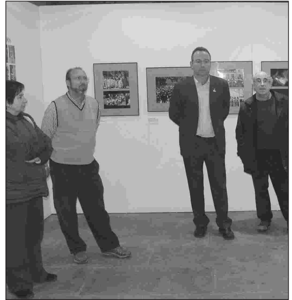
I LA MOSTRA ACULL FOTOGRAFIES, VESTITS...

Autoritats i comparses celebren l'Aniversari amb una retrospectiva