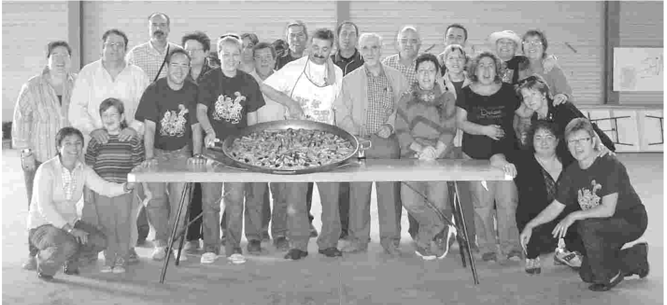
I ELS MEMBRES DE LA COMPARSA VAN GAUDIR D'UNA SABOROSA PAELLA