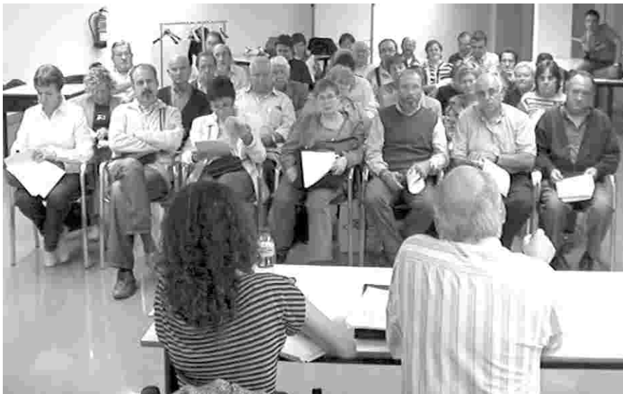
EL PROTOCOL ES VA APROVAR EN ASSEMBLEA EL PROPPASSAT 26 D'OCTUBRE.

L'Associació de la Festa de Moros i Cristians de Lleida va aprovar, per unanimitat i en Assemblea General Extraordinària, el protocol que regirà a partir d'ara la Festa. L'Assemblea –que va tenir lloc el dia 26 d'octubre al Centre Cívic de l'Ereta i va comptar amb una elevada participació– va consensuar, després del seu debat i diverses puntualitzacions, el pla escrit i detallat de totes les normes que han de regir la Festa, tant a nivell intern, com pel que fa a la seva projecció exterior.