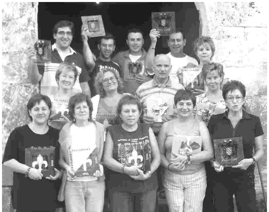
I ELS PALLARESOS, D'ANIVERSARI.

Després del dinar es va realitzar un acte de reconeixement als membres de la comparsa que van desfilar en la primera edició de la Festa. També es va distingir a aquells membres que durant aquests deu anys han ocupat el càrrec de capità o abanderat de la comparsa cristiana dels Pallaresos.