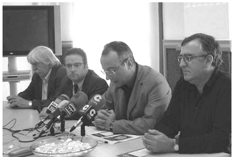
I ELS AMICS DE LA SEU VELLA VAN PRESENTAR LA FIRA.

L'Associació de Moros i Cristians de Lleida col·laboraran amb els Amics de la Seu Vella en la celebració de la fira Histolleida que aplegarà festes de caire historicista de les Terres de Ponent i es celebrarà al turó del monument lleidatà durant un cap de setmana del 2007 encara per determinar.