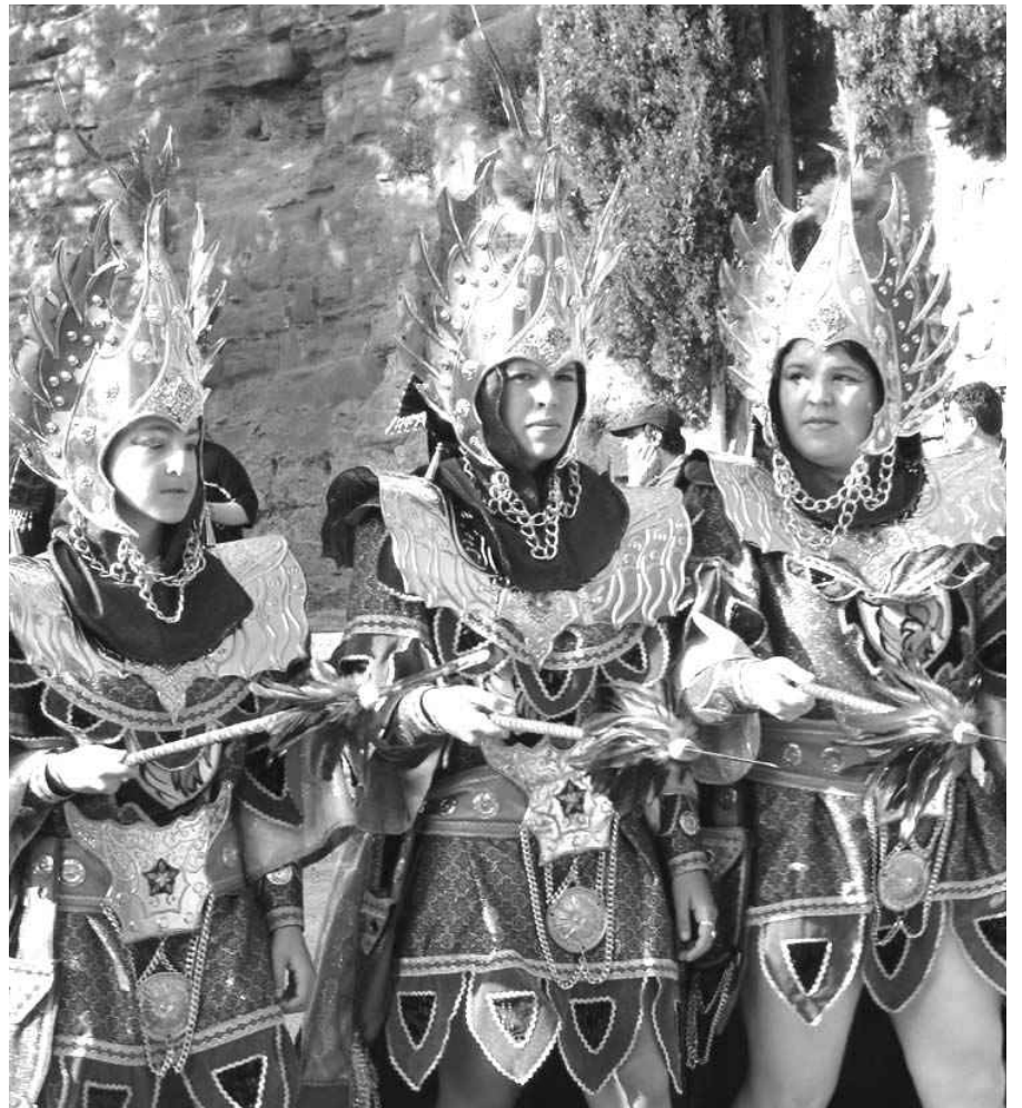
I LES DESFILADES DE NENS I ADULTS VAN OMLIR DE PÚBLIC ELS DIFERENTS RECORREGUTS.