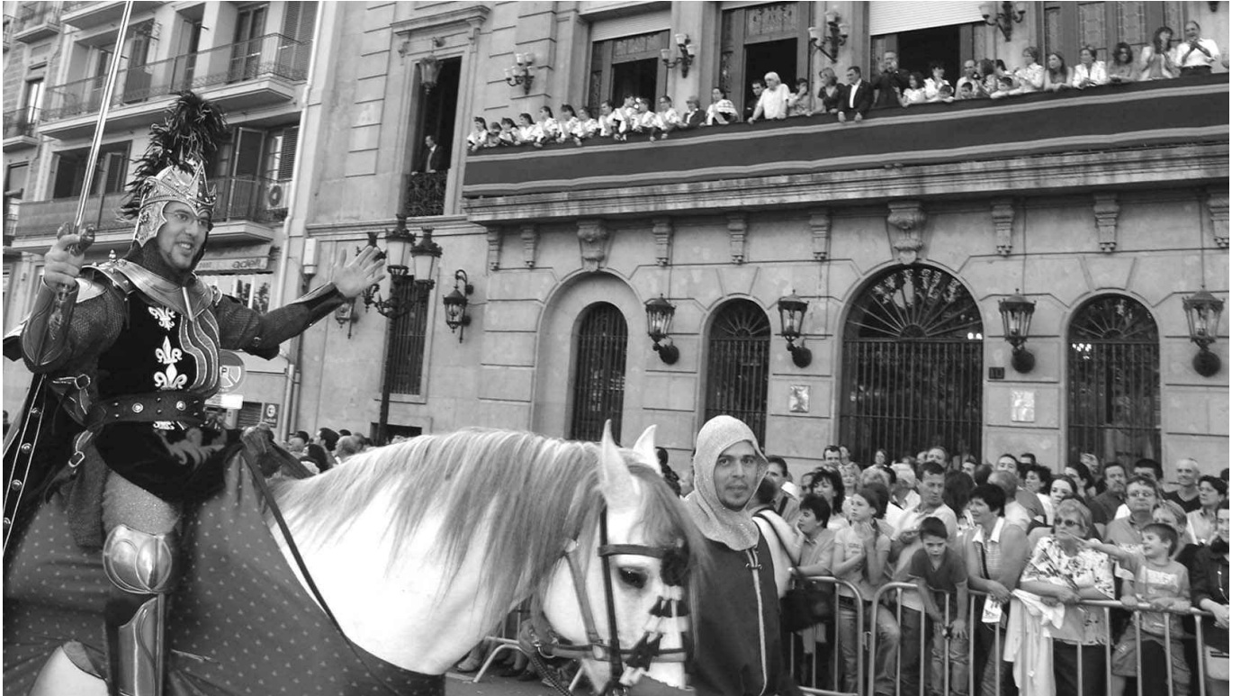
I ARNAU MIR I DE PALLARS VA RECONQUERIR LA CIUTAT DE LLEIDA PELS CRISTIANS.

Cap al tard, a les muralles de la plaça de la Sardana de la Seu Vella, els moros i cristians s'enfrontaren per obtenir el control de la ciutat. La Batalla es va iniciar a les 21.00h amb un espectacle músico-teatral i va donar pas a la dura confrontació, que finalitzà amb la mort del capità moro Muhammed Ibn Lup Al.leridí-Almudèfar sota l'espasa del comte cristià Arnau Mir I de Pallars.