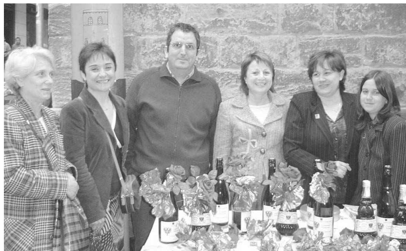
l'ELS FESTERS VAN SORTIR AL CARRER PER SANT JORDI.

de cosi fan tutte, Kv 588 (WA Mozart 1756-1791), Simfonia per a gran orquestra: Allegro, Minuet i Allegro molto (JC de Arriaga 1806-1826), Dansa eslava op. 46 núm. 8 en sol m (A Dvórák 1841-1904) i Marxa Radetzky (J.Strauss 18004-1849).