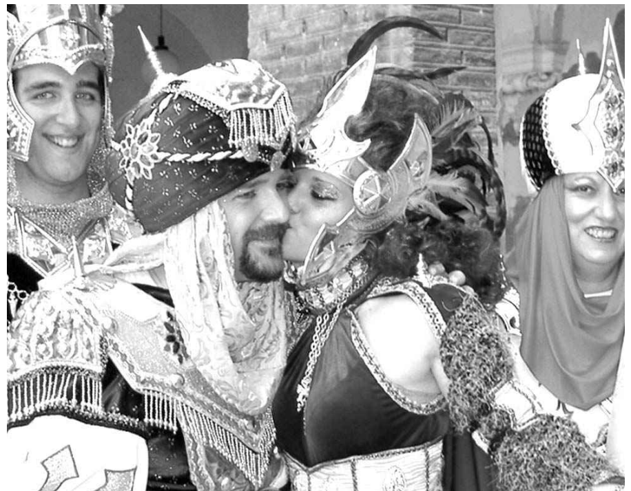
I MOROS I CRISTIANS VAN DONAR EXEMPLE DE CONVIVÈNCIA.

cristianes van fer la seva aparició. Guiades pels Pallaresos, les comparses dels Urgellens i els Anglesola van marcar el pas entre banda i banda de música, desfilant en filades de cristianes i cristians.