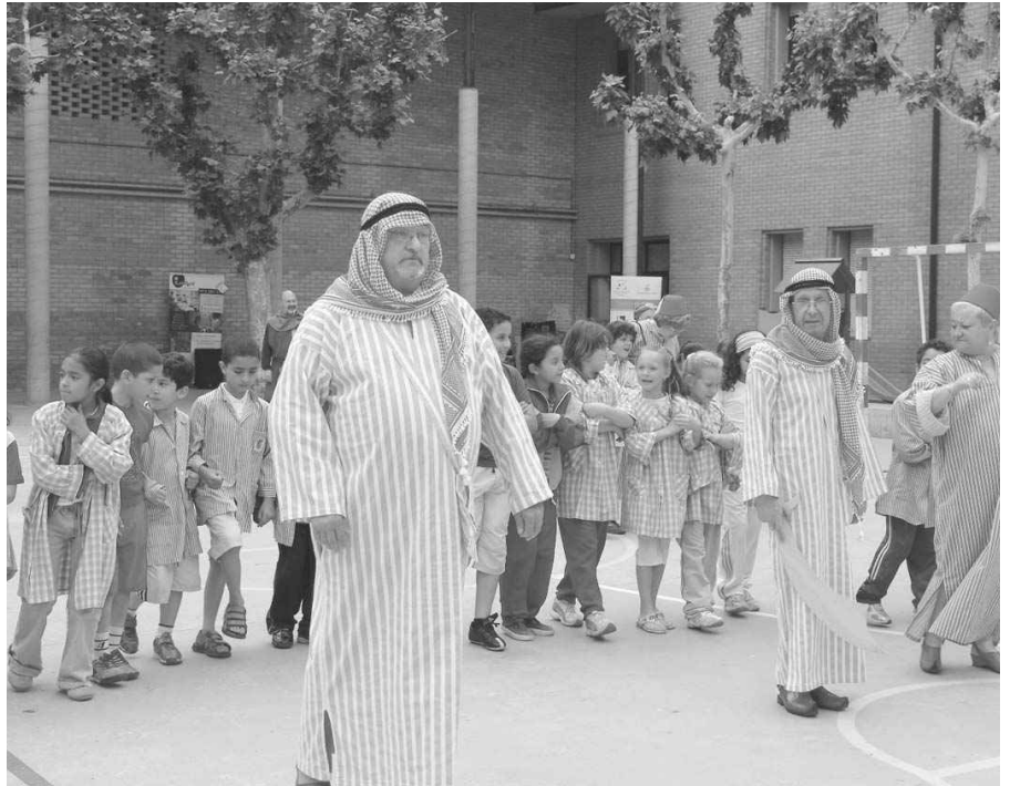
I ELS NENS I NENES DEL PRÍNCIP DE VIANA VAN GAUDIR DE LA FESTA AL COL·LEGI.

Els alumnes van desfilars per classes, tot i que al final es va fer una desfilada conjunta i tots els nens i nenes van anar darrere els moros i cristians lleidatans, fent un fi de festa tots plegats.