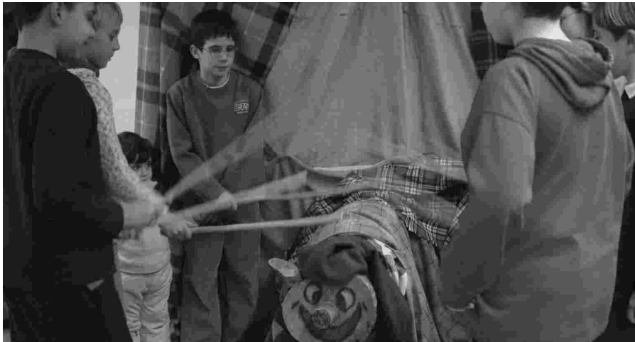
I ELS MÉS PETITS ESPEREN EL TIÓ DE NADAL DE L'ASSOCIACIÓ.

L'entitat estudia organitzar nous tallers infantils de Nadal