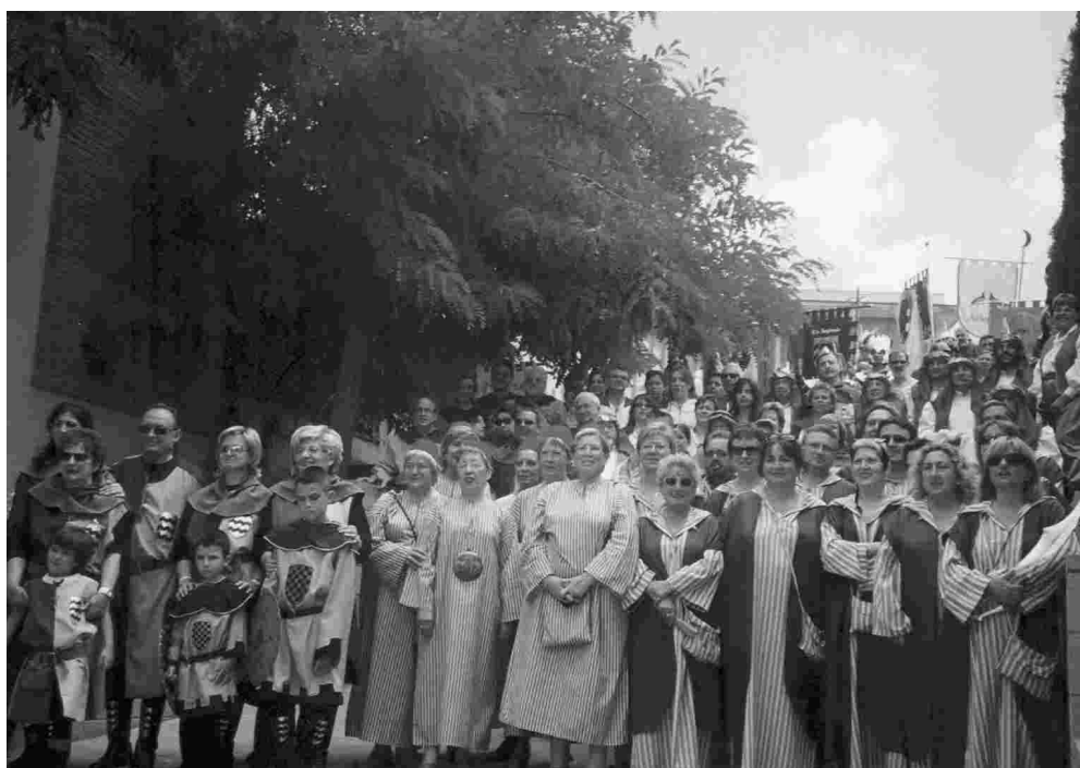
I ELS FESTERS MOROS I CRISTIANS VAN DESFILAR PELS CARRERS DE LA LOCALITAT.

Amb motiu de la Capitalitat de la Cultura Catalana 2005 de la ciutat barcelonina