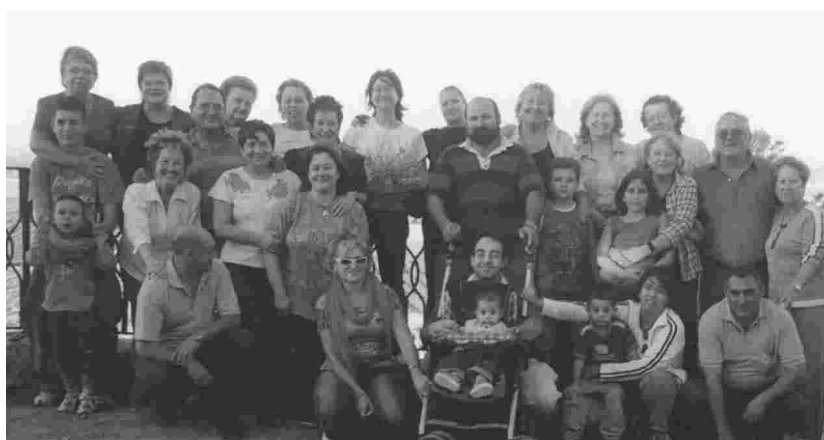
I LES COMPARSES COBREN VIDA SOCIAL PRÒPIA.