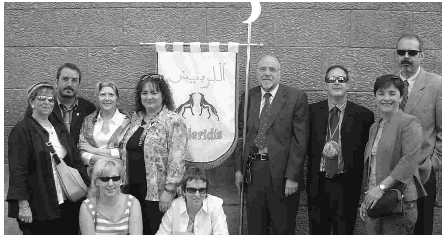
I ELS AL-LERIDIS VAN PARTICIPAR EN L'OFRENA FLORAL.

Els Al-leridis van fer pinya i han fet arribar una fotografia de la diada pel butlletí.