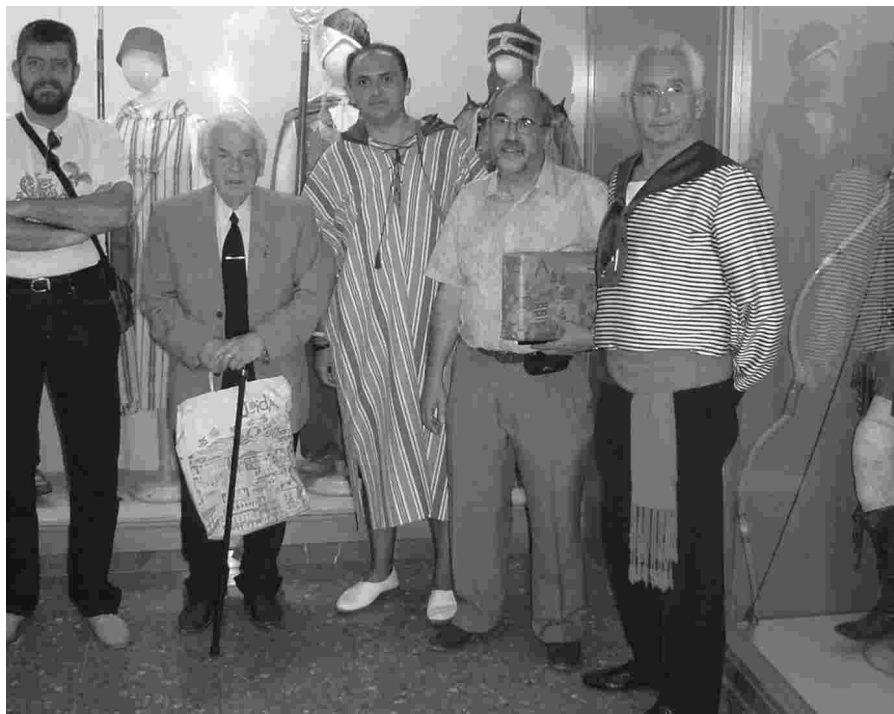
I LA FESTA LLEIDATANA VA REFORÇAR ELS LLIGAMS AMB ELS AMICS VALENCIANS.

Els lleidatans van ser acollits per la comparsa de "Els Mariners"