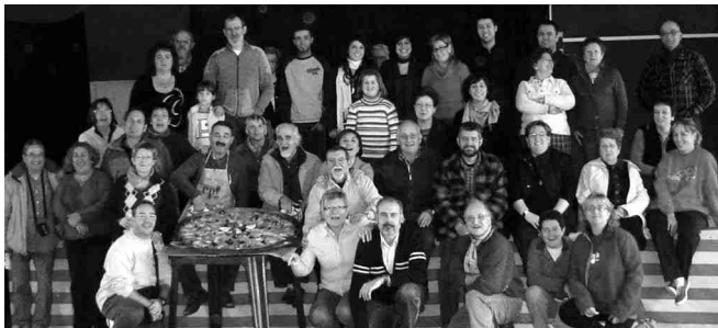
ELS AL-LERIDÍS A LA PARTIDA DE RUFEA