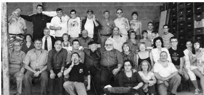
ELS URGELLENCS ES VAN REUNIR A ALBATÀRREC.

Més d'una trentena d'Urgellencs van reunir-se, el passat 5 d'octubre, per celebrar un dinar de germanor plegats. La trobada es va realitzar a Albatàrrec,