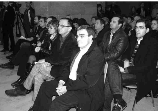
LES AUTORITATS VAN ESTAR PRESENTS AL RELLEU.