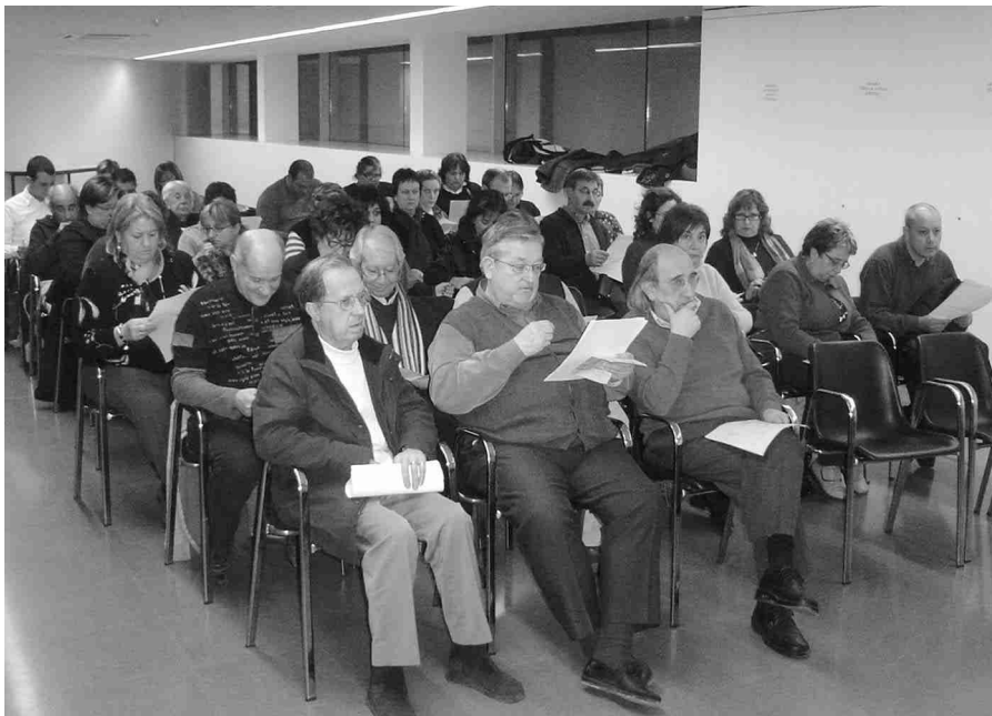
l'ERETA VA ACOLLIR L'ASSEMBLEA DEL DIMARTS 3 DE FEBRER.

millors fotografies realitzades durant el dia de la Festa. Aquesta va ser una de les decisions que va prendre l'Assemblea de socis i sòcies de l'entitat durant la seva reunió anual que va tenir lloc el passat 3 de febrer al Centre Cívic del Centre Històric. La reunió va servir, a més, per marcar les pautes de treball de l'Associació que aniran encarades a potenciar la presència de la Festa fora de Lleida, fet que s'aconseguirà participant en fires turístiques o realitzant desfilades promocionals arreu, per exemple; aconseguint així que la celebració lleidatana s'identifiqui amb la ciutat. Altres temes tractats van ser la intenció de mantenir el conveni amb la Diputació de Lleida pel que fa a la subvenció per confeccionar indumentària historicista, així com renovar el conveni amb l'Arxiu de la Corona d'Aragó per realitzar presentacions a Barcelona. Finalment, l'Assemblea va decidir crear la figura dels "Amics de la Festa" amb l'objectiu d'aconseguir involucrar institucions, entitats, particulars i tota mena de col·lectius en la Festa de Moros i Cristians de Lleida.