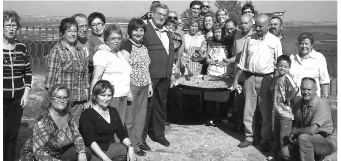
l'ERMITA DE CARRASUMADA VA ACOLLIR LA CELEBRACIÓ.

L'Ermida de Carrassumada de Torres de Segre va ser l'escenari, el 16 de novembre, d'una doble celebració dels Pallaresos. Per una banda, el dotzè aniversari d'aquesta comparsa cristiana que va aprofitar, a més, per gaudir del tradicional dinar de tardor. Tothom va poder tastar la saborosa paella elaborada per unes grans cuineres, les "Maries". Després de dinar, es va lliurar un plat commemoratiu als festers que han complert 10 anys dins dels Pallaresos.