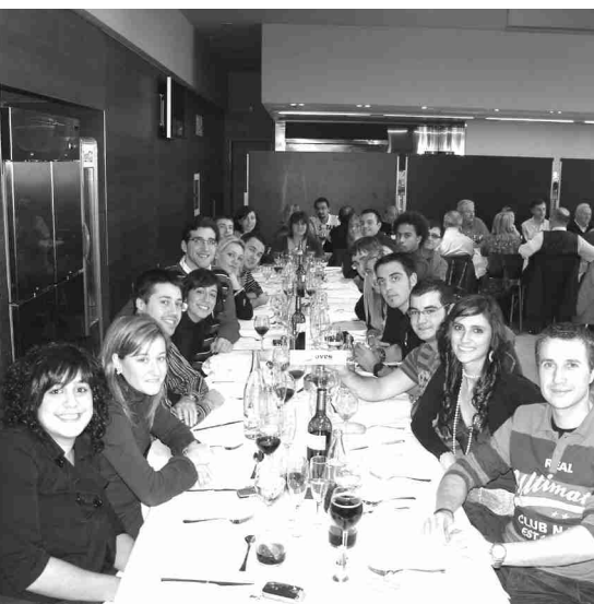
NEOPARC VA ACOLLIR EL DINAR DE GERMANOR.