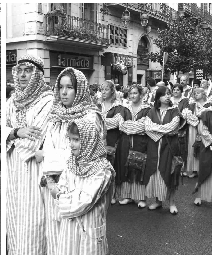
UNA TRENTENA DE FESTERS I FESTERES VAN LLUIR ELS DIFERENTS VESTITS DE PROTOCOL DE LA FESTA.