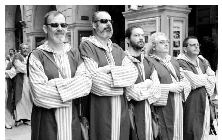
DURANT UNA DE LES ENTRADES INFANTILS