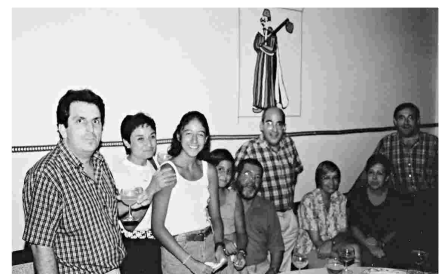
FESTA A ONTINYENT