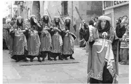
EL XAVIER DESFILANT PEL CARRER CAVALLERS

"Existen múltiples diferencias entre ambas marchas. Las moras tienen un carácter marcadamente solemne y la cadencia puede percibirse claramente mientras que el tiempo de la marcha cristiana es más rápido y propio de un desfile", dijo Massot. El especialista explicó las diversas marchas encontradas en cada bando, cinco en el moro y tres por lo que respecta a los cristianos.