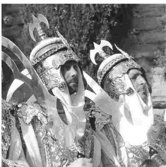
EL XAVIER DURANT LA DESFILADA DE 2005 I 2007, RESP.