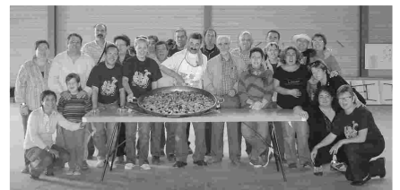
PAELLA A RUFEA