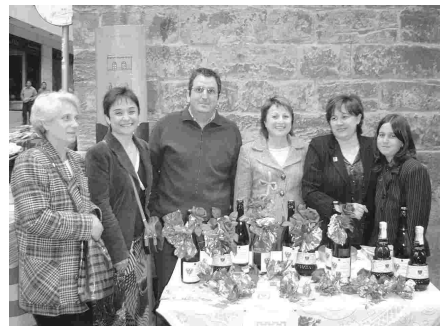
SANT JORDI 2006