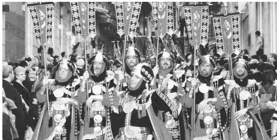
"EL CABO AMB MÉS SALERO"