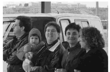
EN UNA CALÇOTADA A RUFEA