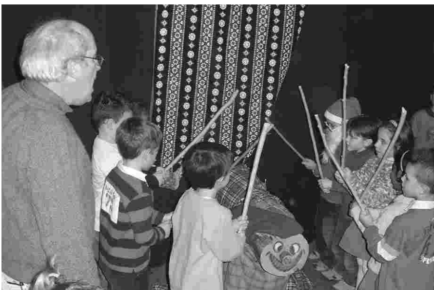
I ELS MÉS PETITS DE LA FESTA FENT CAGAR EL TIÓ DE NADAL

La Festa va organitzar el "cagatió" i tallers amb material reciclat per als més petits