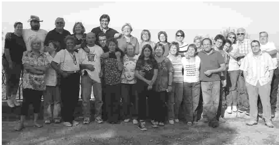
I L'ERMITA DE CARRASSUMADA VA ACOLLIR L'ANIVERSARI DEL PALLARESOS.