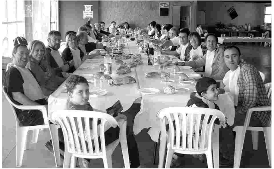
I LA CALÇOTADA VA TENIR LLOC A RUFFA.