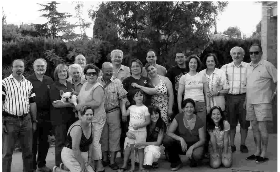
I ELS ANGESOLA TAMBÉ VAN FER UN DINAR A L'ESTIU.