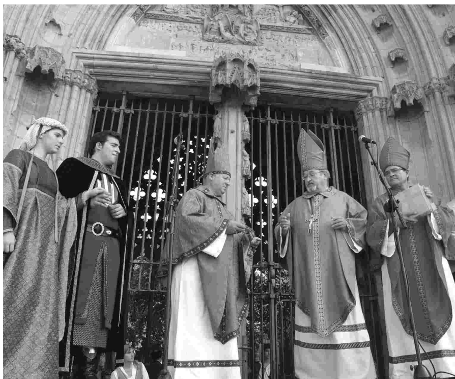
I LES NOCES VAN SER TOT UN ÈXIT I FORMARAN PART DEL CALENDARI FESTER.

La recreació de la unió de Ramon Berenguer IV amb la Peronella d'Aragó va ser un acte programat dins del programa "Lleida Ciutat Cultural".