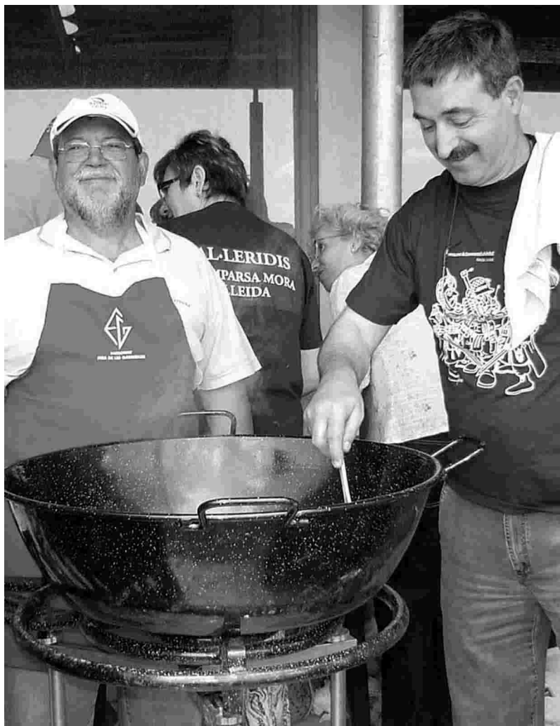
I ELS AL·LERIDÍS PARTICIPEN A LES CASSOLES DE RUFEA DE FORMA HABITUAL.