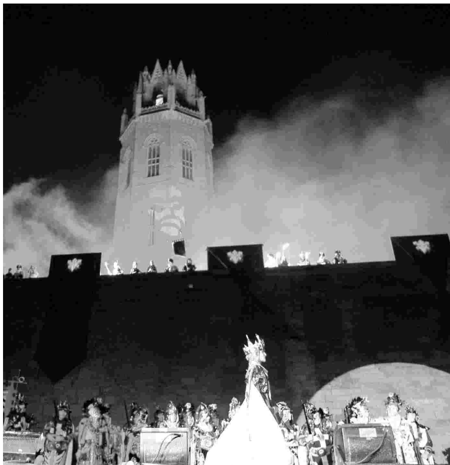
I LA BATALLA VA SER FORÇA TEATRAL.

En aquesta desfilada, les tropes mores liderades pels Musa van avançar amb tots els elements característics d'una madina àrab, una ciutat andalusí. La festa es va desplaçar a última hora de la tarda a la Seu Vella, on es va celebrar la tradicional Batalla, que en aquesta ocasió va donar la victòria a les comparses mores. L'escenificació de la Batalla, aquest any a càrrec de la companyia Alea Teatre, va comptar amb una posada en escena molt dinàmica que va incloure nous espais, com el pont llevadís. En principi es va representar una ciutat en festa, que posteriorment va ser atacada per les comparses mores dels Musa, els Al-leridís i els Banu-Hud. En el parlament de la Batalla, la capitana dels Musa va proposar a la seva homòloga cristiana decidir el futur de la ciutat a través d'una consulta electoral, fent referència al moment electoral que estem vivint. Després de barallar la idea i de sopesar els pros i els contres van decidir deixar aquesta idea per a properes generacions. Finalment, va començar la batalla que va donar la victòria als Musa, així Madina Larina viurà un any sota el domini dels sarraïns. L'any vinent, la lluita pel domini de la ciutat es reviurà un altre cop. Els cristians entraran a Lleida per reconquerir-la. De moment però, els Musa, els Banu-Hud i els Al-leridís tenen el privilegi de gaudir de la ciutat durant tot un any.