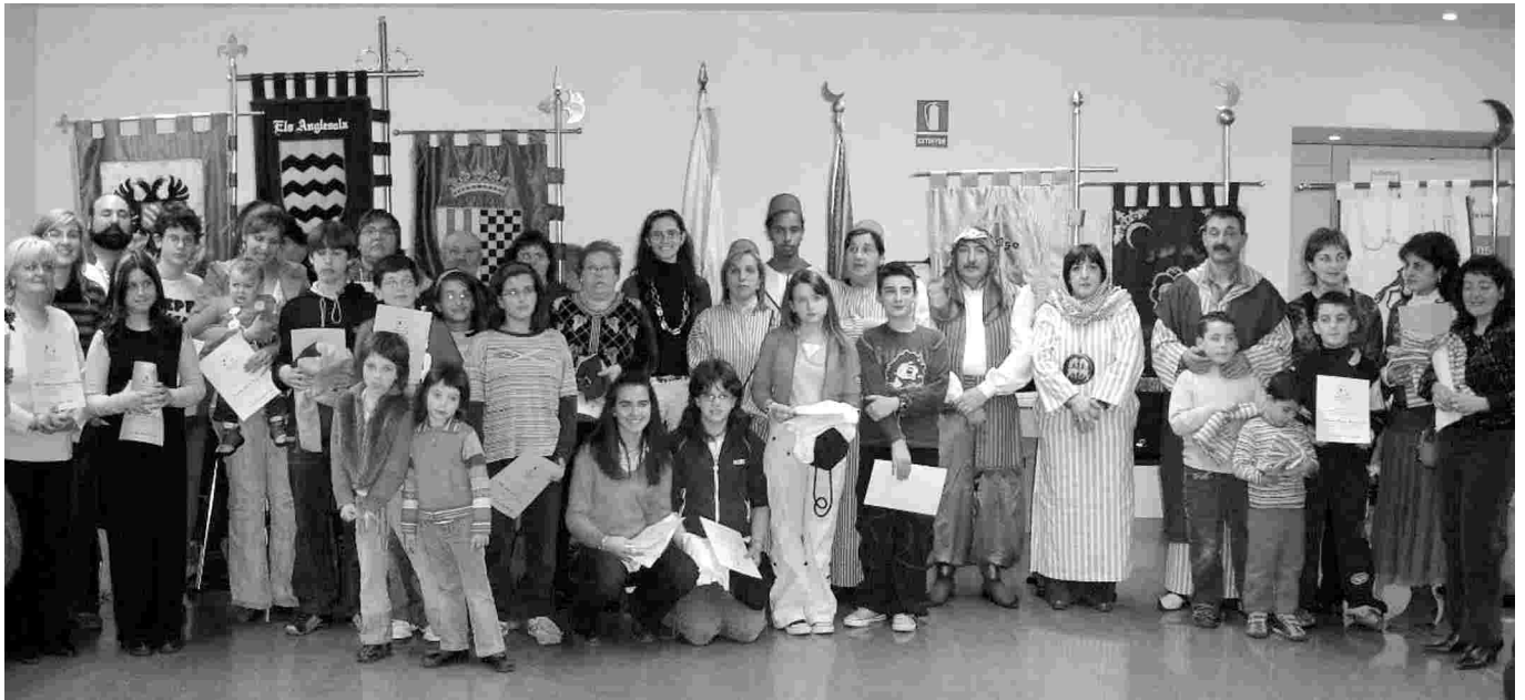
I LES CAPITANIES MORA I CRISTIANA VAN DONAR LA BENVINGUDA ALS NOUS FESTERS I FESTERES.