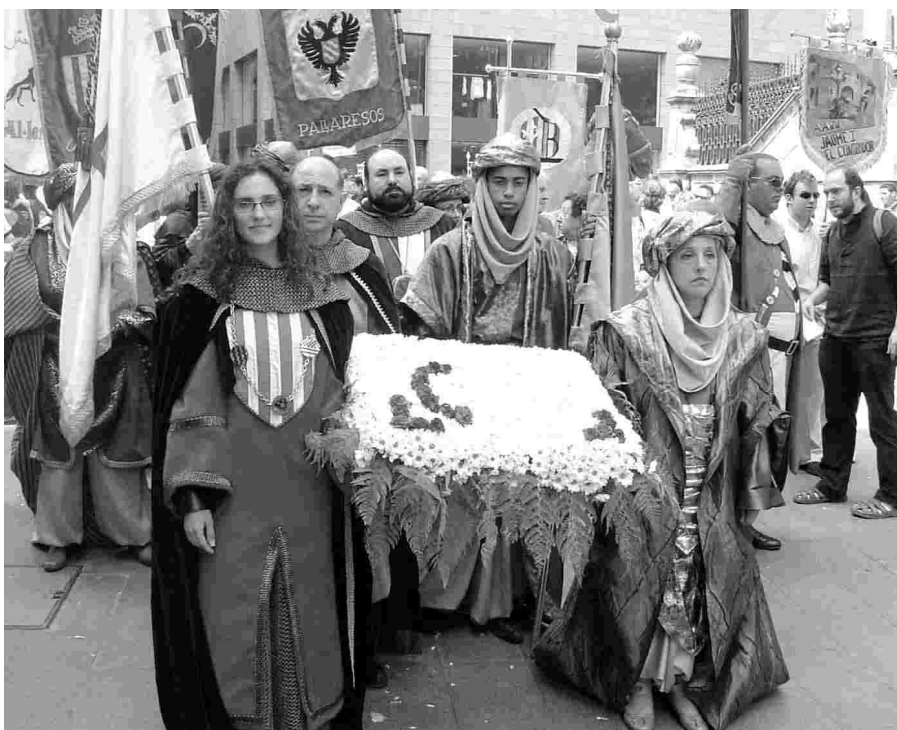
I MEMBRES DE LA FESTA VAN PARTICIPAR EN L'OFRENA A SANT ANASTASI.

de les comparses lleidatanes dels Urgellencs, Pallaresos, Anglesola, Musa, Al-leridís i Banu Hud van donar la benvinguda als nous festers. Després de l'acte es va celebrar un sopar i es va desfilar amb música festera.