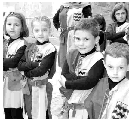
I ELS MÉS PETITS TAMBÉ VAN DESFILAR AMB ORGULL AMB ELS VESTITS DE LES SEVES COMPARSES.