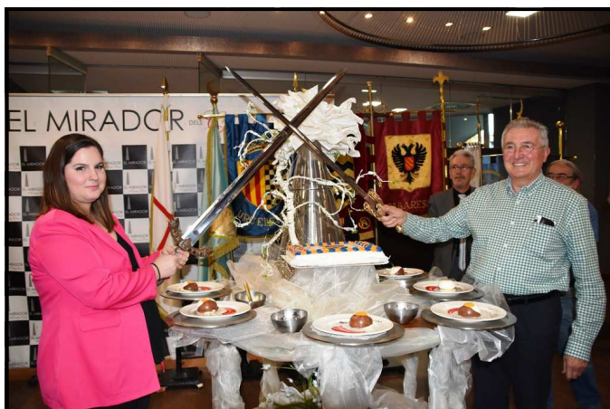
Comtessa i caid tallant el pastís commemoratiu del dinar fester