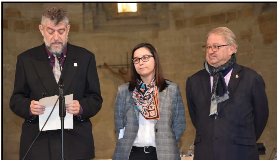
Autoritats que van presidir el Mig Any Fester