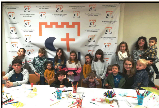
Nens i nenes que van dibuixar la targeta de Nadal