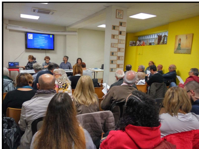
Festers assistents a l'Assemblea General Ordinària

El 30 d'octubre, al local social, es va celebrar l'Assemblea Anual Ordinària de l'Associació. Es van aprovar l'acta de l'assemblea anterior, la memòria-balanç i l'estat de comptes de l'any fester 2018-2019, així com també, sense cap esmena, el pressupost i el programa d'activitats pel curs 2019-2020