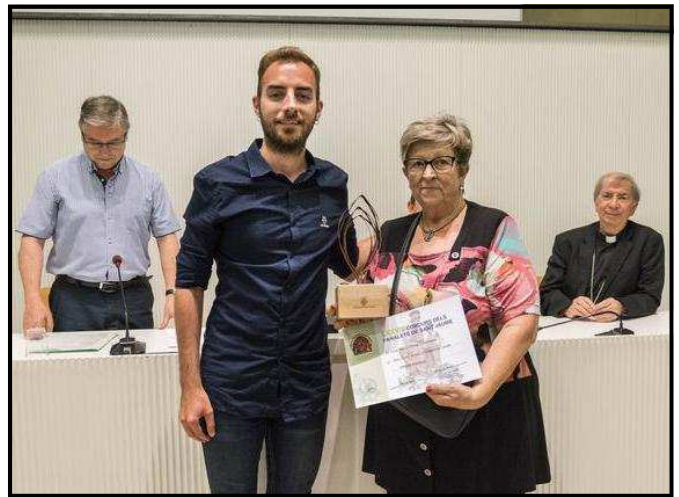
Lliurament del premi a l'Associació de la Festa de Moros i Cristians