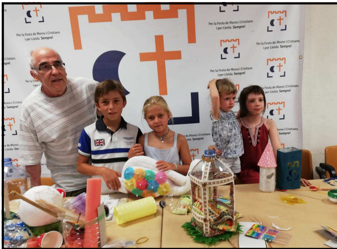
Taller de fanalets al local social del carrer Panera