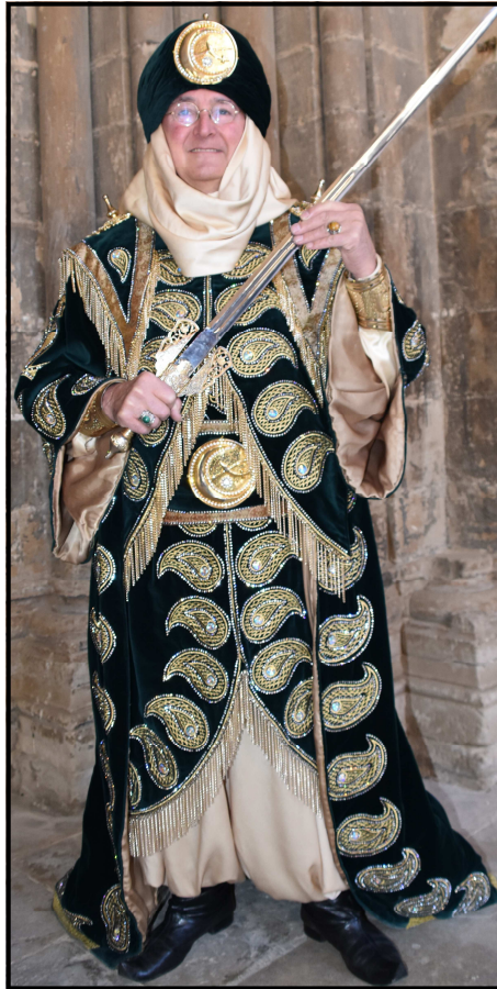
Antoni Pomés, caid dels Banu-Hud

A Còrdova estant, el jove Abi-Amir va saber moure's pels cercles propers a la cort califal, a la qual s'anà introduint de forma progressiva. Després d'hàbils maniobres conspiradores i difícils jocs d'aliances i intrigues califals de tots els colors, podem afirmar que vers l'any 978 Abi-Amir controlava tot l'aparell burocràtic i administratiu del Califat.