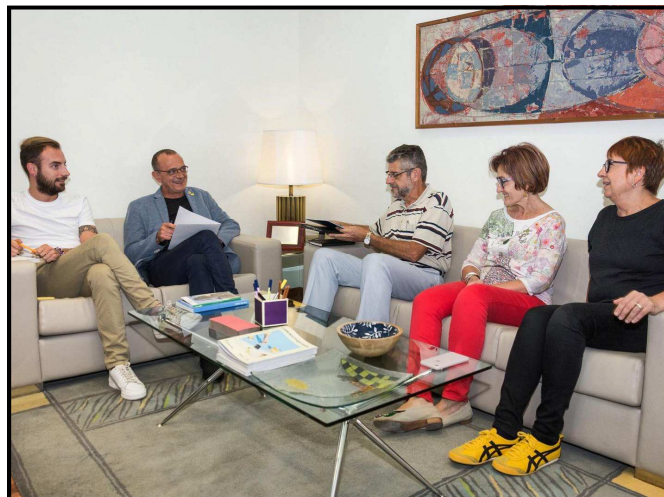
Reunió amb l'alcalde de la ciutat

El 30 d'octubre, al local social, es va celebrar l'Assemblea Anual Ordinària de l'Associació. Es van aprovar l'acta de l'assemblea anterior, la memòria-balanç i l'estat de comptes de l'any fester 2018-2019, així com també, sense cap esmena, el pressupost i el programa d'activitats pel curs 2019-2020