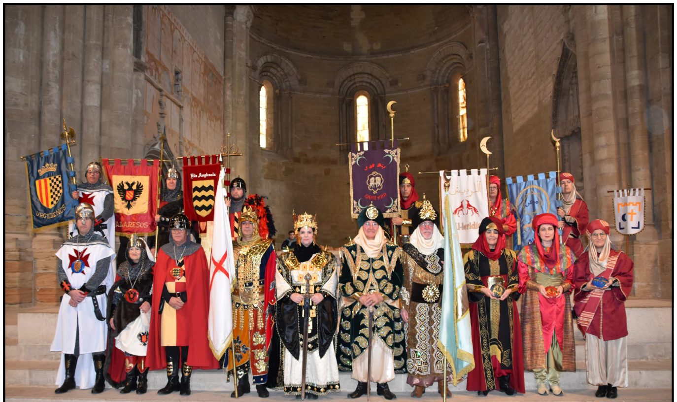
Els nous càrrecs de la Festa a l'altar major de la Seu Vella