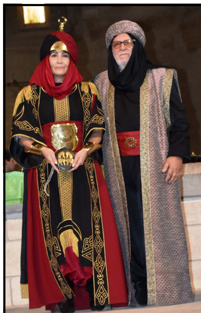
Araceli Conesa, xec dels Banu-Hud