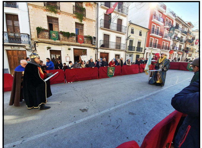
Interpretació de les Ambaixades

El dissabte 7 de desembre una representació de la Festa de Moros i Cristians de Lleida es va desplaçar al poble alacantí de la Font de la Figuera per participar en la "V Trobada d'Ambaixades", organitzada per l'Àrea I de l'UNDEF.