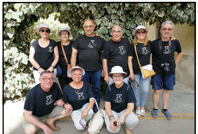
Foto de grup dels festers que van viatjar a Cocentaina

El passat 10 d'agost, un grup de festers i festeres de l'Associació van viatjar a la localitat de Cocentaina per gaudir de la "entrada" de la festa de moros i cristians que es celebra en honor de Sant Hipòlit, patró de la vila des de l'any 1.600. Aquesta festa està declarada d'interès turístic.