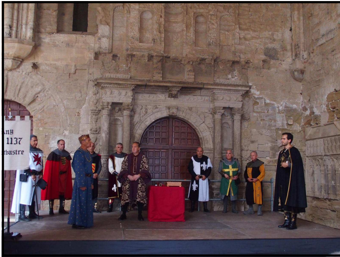
Any 1137, capitulacions matrimonials a Barbastro