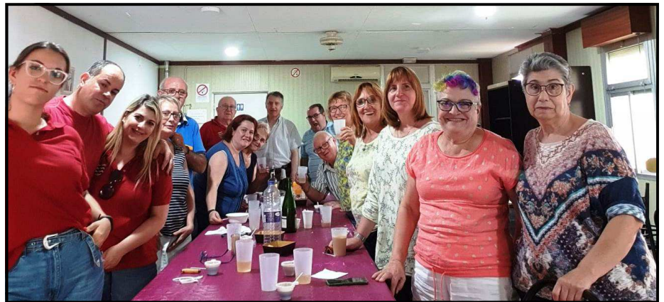
Foto de grup del dinar de l'Assemblea Anual dels Anglesola a la Saira

Van aprofitar la reunió per preparar la capitania del bàndol cristià que ostentaran el proper any fester.