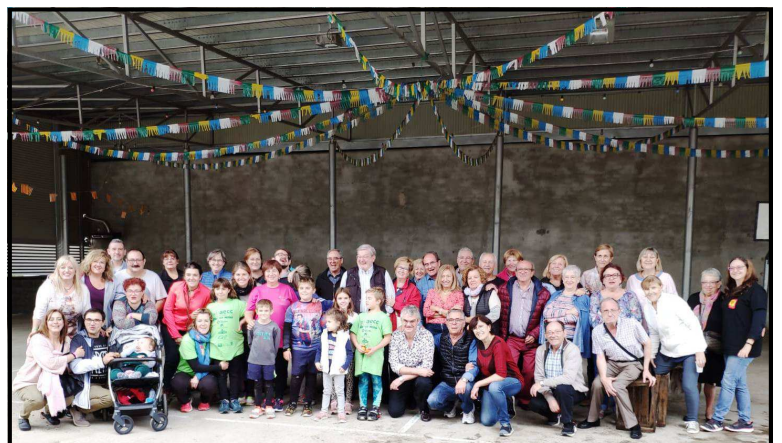
Foto de grup dels Pallaresos al local social de Gualda

En aquesta ocasió van poder gaudir d'una magnífica fideuà.