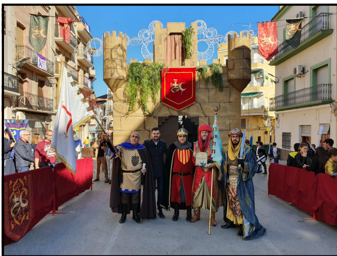
Festers participants la V Trobada d'Ambaixades