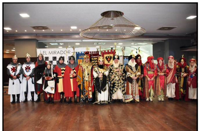
Tots els nous càrrecs de la Festa al dinar del Mig Any