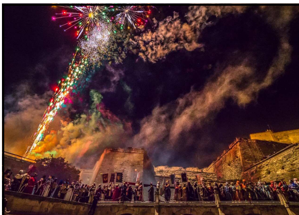
"La celebració" foto guanyadora del concurs

Eloy Sarrat Grasa va guanyar L' XI Memorial Xavier Aluja de fotografia amb la imatge titulada "La Celebració". El premi estava dotat amb 250 euros. L' exposició de fotos presentades va romandre oberta al Cercle de Belles Arts del 5 al 29 de novembre.