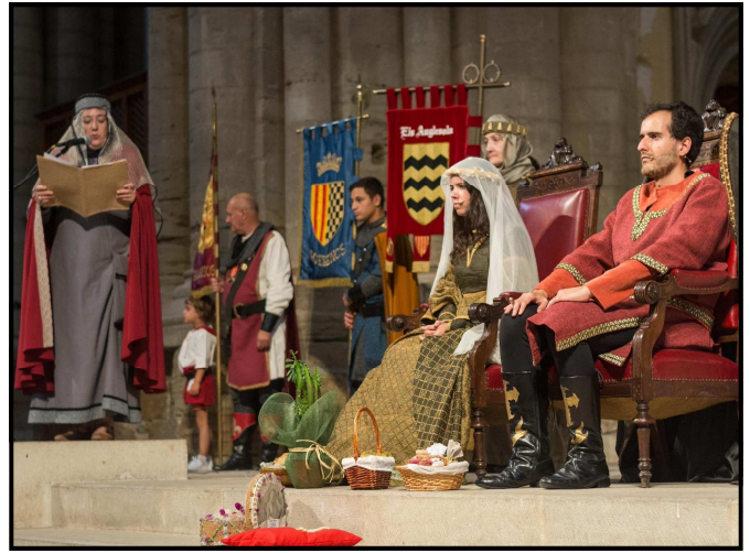
Any 1150, casament de Ramon Berenguer i Peronella a Lleida