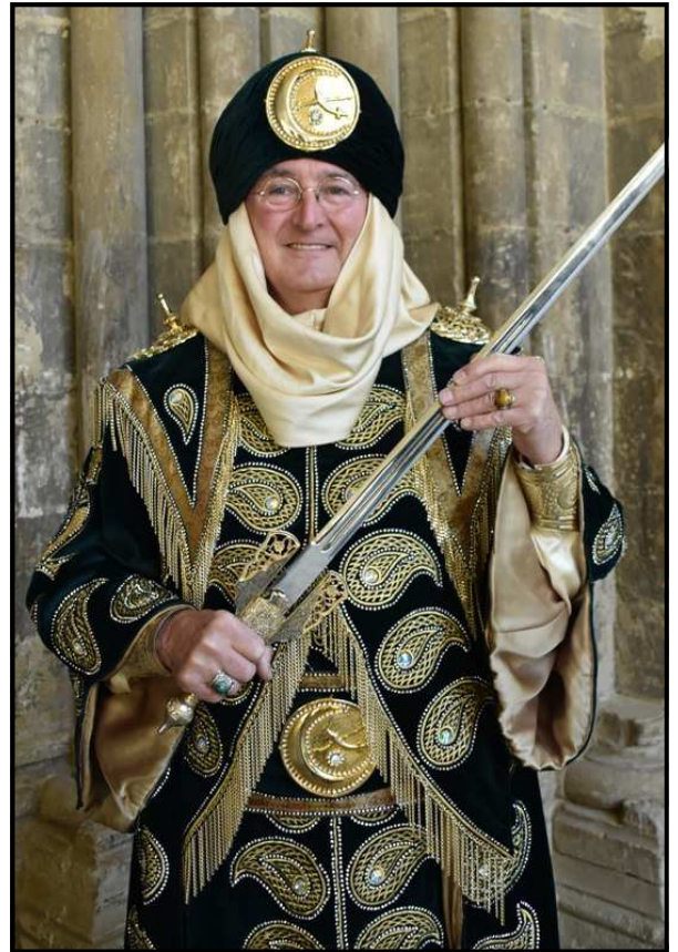
Antoni Pomés Tosquella, caid dels Banu-Hud