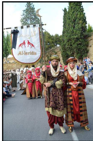
Xeic i aAam dels Al·leridís