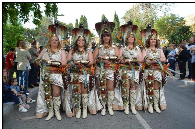
Filada de llument dels Pallaresos

Darrere les filades de les comparses dels Musa i dels Banu-Hud, amb els seus Xeics i