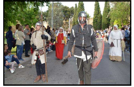
Poble i guerrers Falcons de Leyda