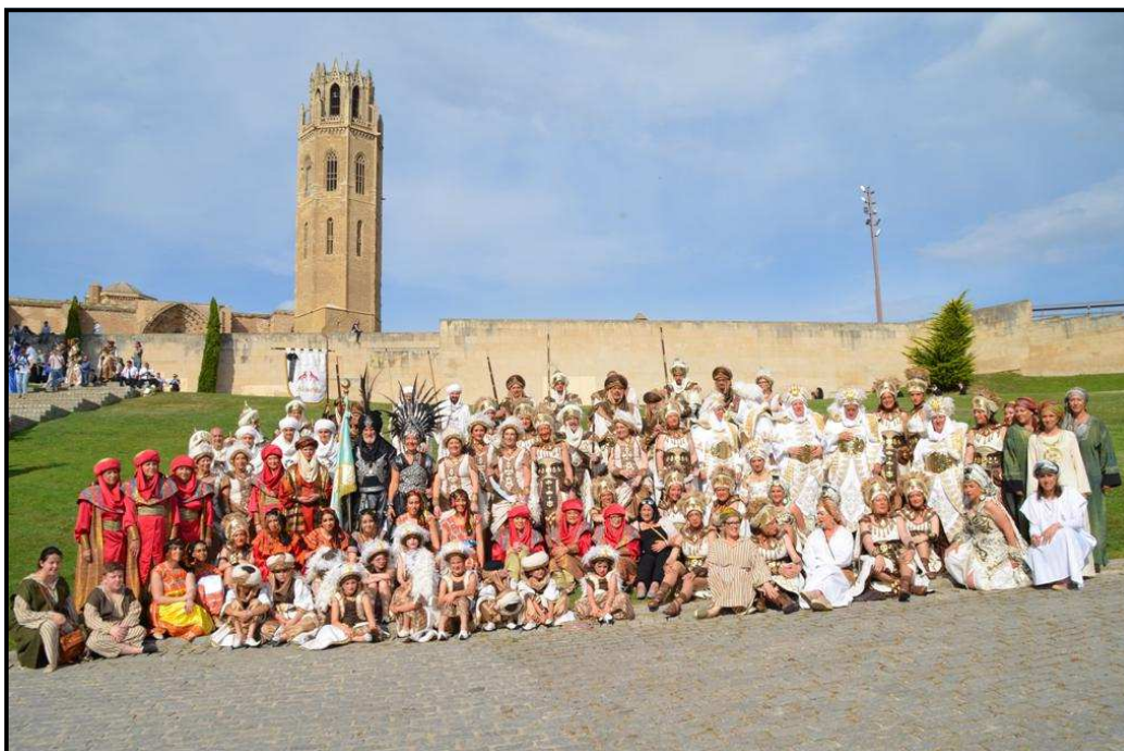
La comparsa dels Al·leridís a la Seu Vella de Lleida