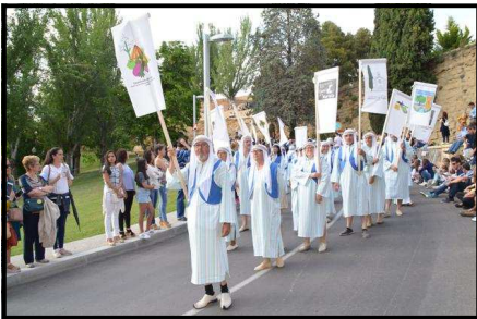
L'Horta de Larida