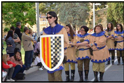
Escorta dels Urgellencs