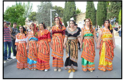
Filada de cultura Amazic