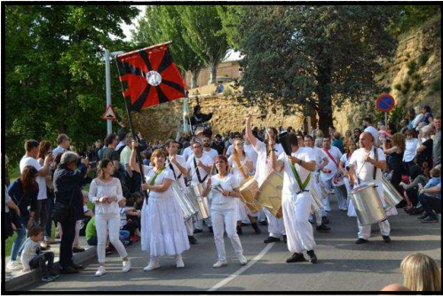
Grup de percussió