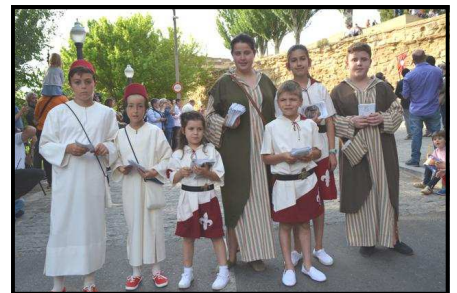
Nens repartint programa d'actes