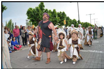
Esquadra infantil "Als Petits"