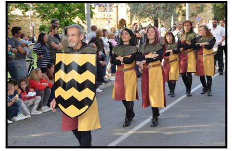
Escorta dels Anglesola