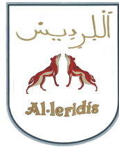
Comparsa fundada l'any 1.995