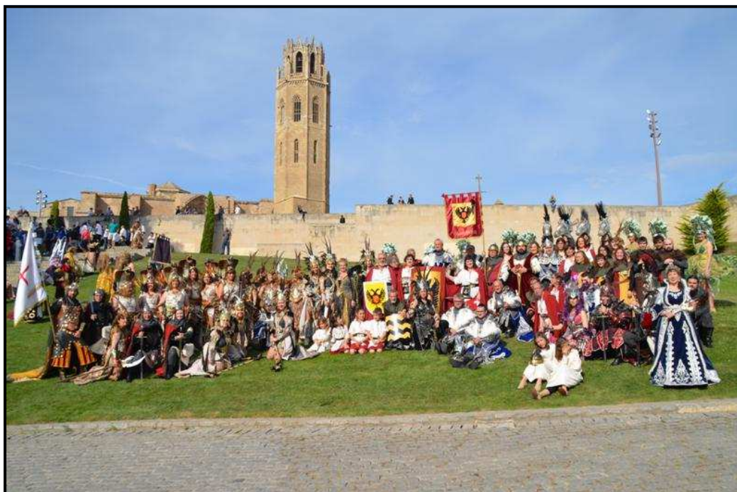
La comparsa dels Pallaresos a la Sen Vella de Lleida