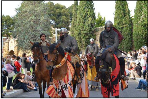
Escorta a cavall