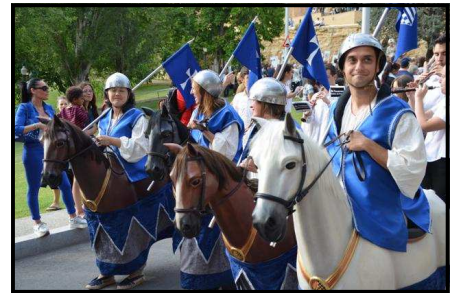
Ball de Cavallets