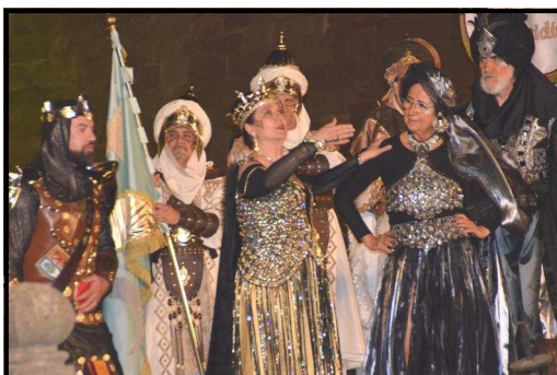
Parlaments de la Comtessa i la Saïda

Després de l'entrada de gala, com a cloenda del magnífic cap de setmana fester i quan començava a caure la nit a les possessions de la Saïda Zobeida, van tornar a sonar els tambors de guerra del bàndol cristià, encapçalat per la seva Comtessa Oria d'Entença, delerosa per tornar a conquerir la seva estimada Lleida.