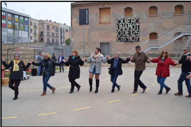
Taller de dansa