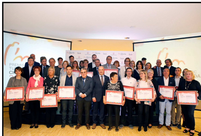
Foto de grup.