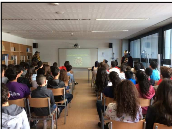
Audiovisual explicatiu de la Festa de Moros i Cristians

La darrera xerrada, al mes d'abril, es va fer a l'escola "La Mitjana" de Lleida.