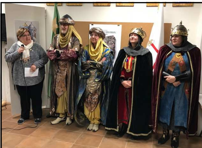
Presentació de l'acte institucional