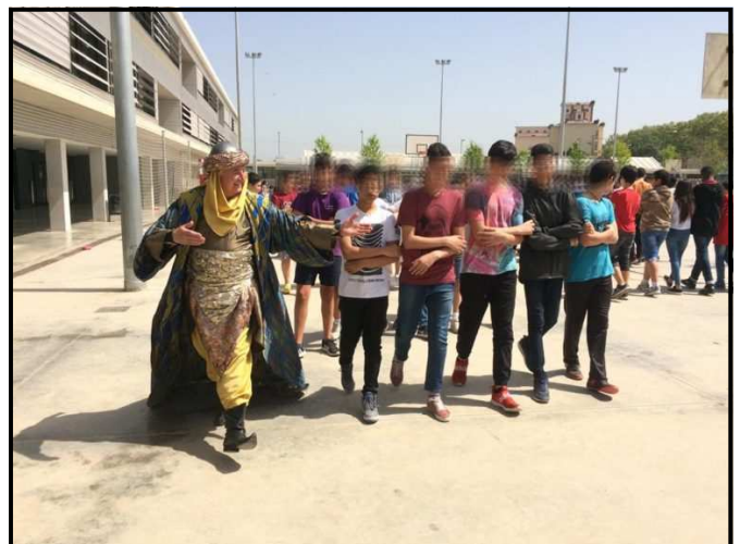
Desfilada al pati del col·legi "La Mitjana"