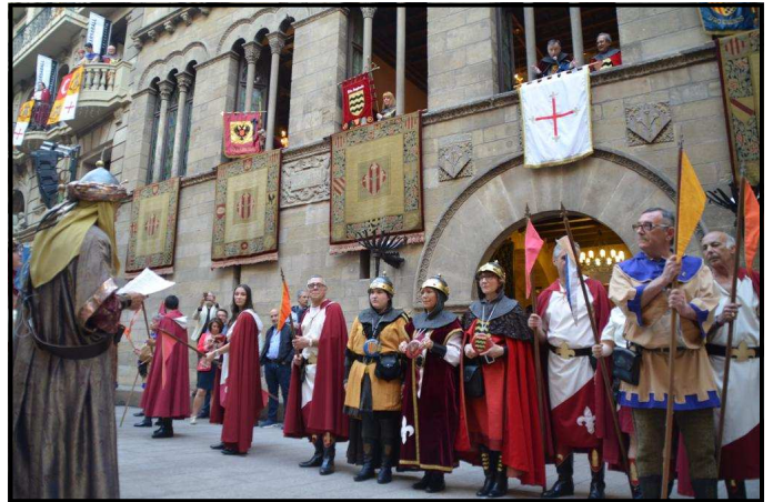
Recreació de les ambaixades amb el text de Roser Perera