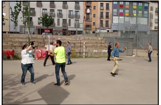
Taller de lluita d'espases