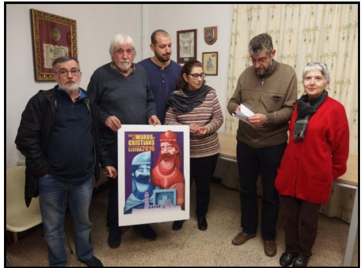
Membres del jurat del concurs de cartells