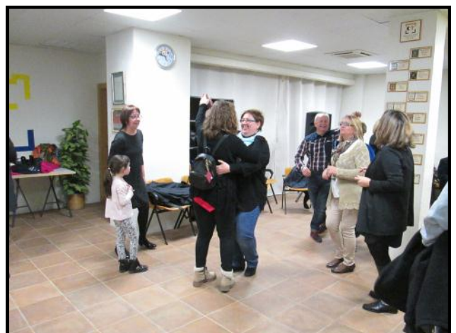
Sessió de ball amb DJ al local social