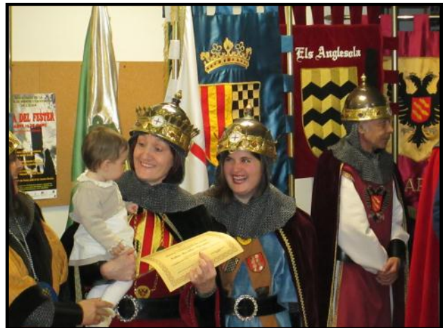
La Comtessa lliura un diploma d'acreditació a una nova festerera