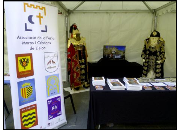
Carpa amb vestits de gal·la, llibres de la Festa i audiovisual