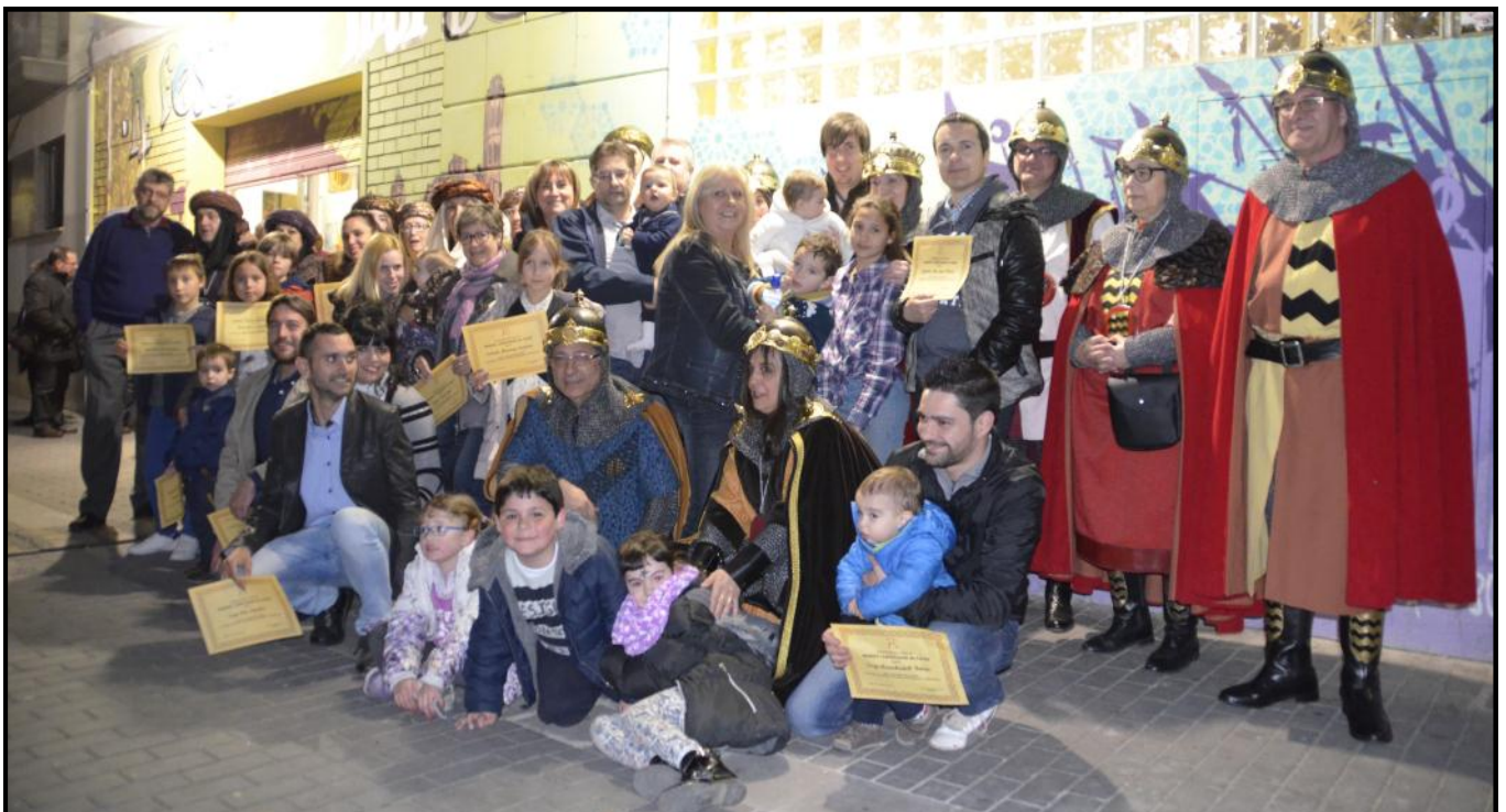
Foto de família dels càrrecs de la Festa i dels nous festers i festeres