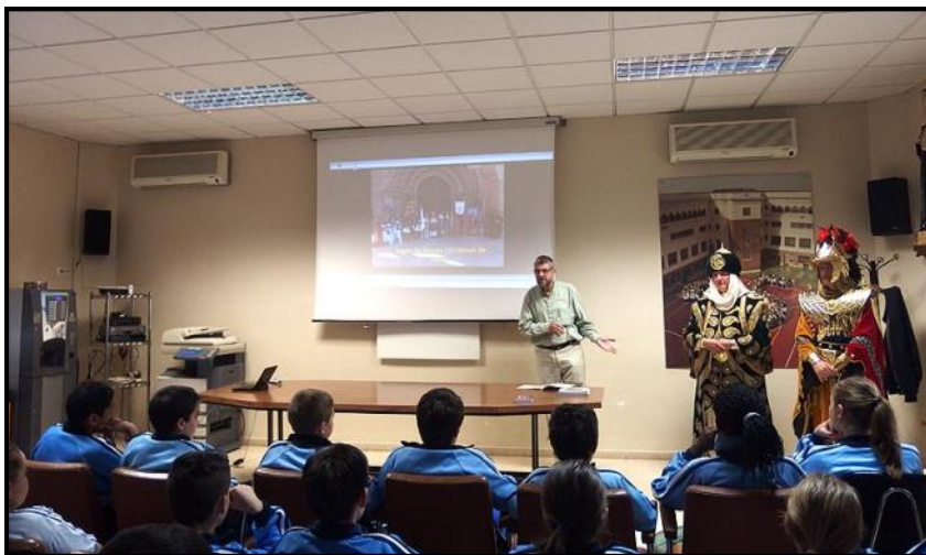
El President de l'Associació fent la xerrada als nens i nenes del col·legi Lestonnac

El dia 19 d'abril vam fer una xerrada informativa al col·legi Lestonnac pels nens i nenes de 5è de primària.