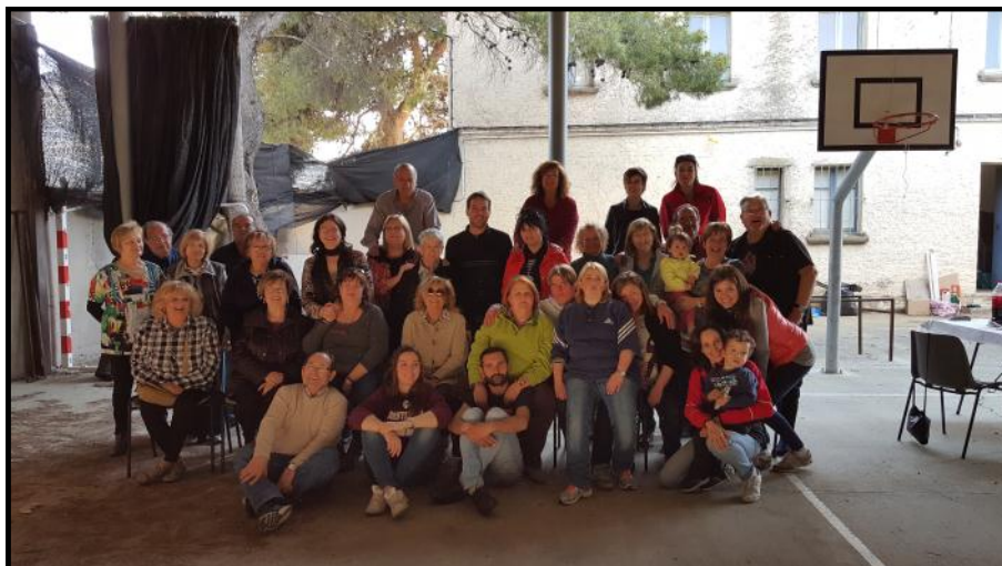
Foto de família dels Pallaresos al local de l'Associació de Veïns del Camí de Montcada