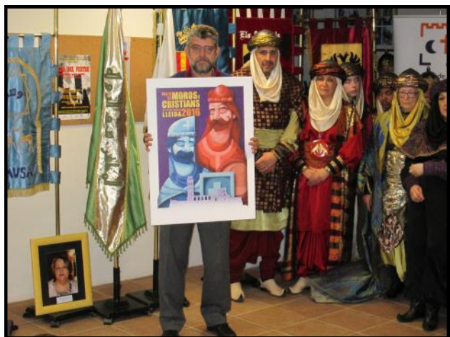
Presentació del Cartell de la Festa 2016