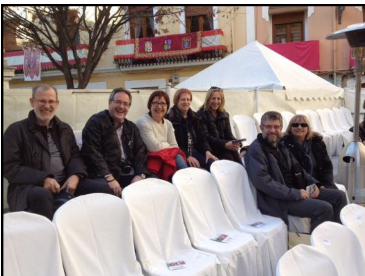
Membres de l'Associació de la Festa de Moros i Cristians de Lleida a Bocairent