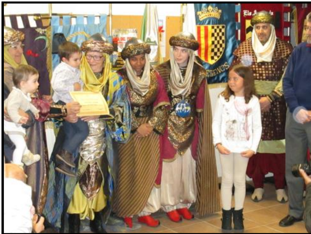
La Saida lliura un diploma d'acreditació a un nou fester