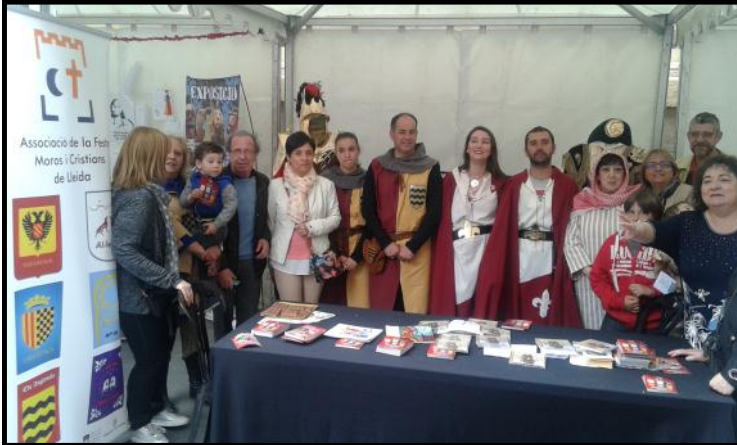
Festers que van col·laborar fent difusió de la Festa

Un any més l'Associació de la Festa de Moros i Cristians de Lleida va participar a la Diada de la Cultura Popular, que es celebrà el dissabte 16 d'abril, instal·lant una carpa a la plaça de la Catedral, on es va fer difusió de la nostra Festa als veïns i visitants de la ciutat.