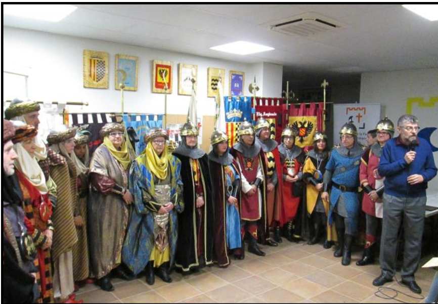
El President de l'Associació dona la benvinguda als nous membres de la Festa

Per acabar la jornada i gairebé fins a mitjanit, es va poder gaudir de una sessió de ball amb la música del DJ Jaume Borràs.