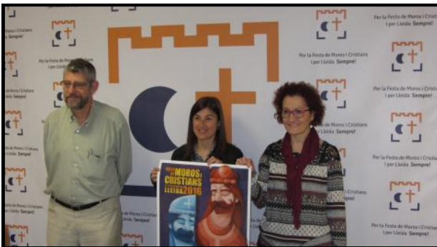
Acte de presentació del Pack turístic pel Cap de Setmana Fester