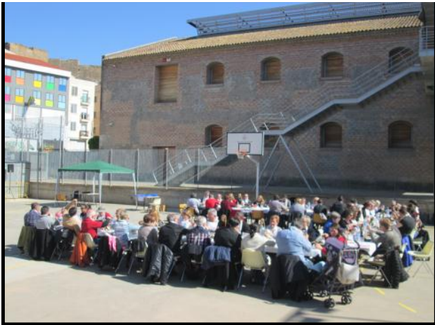
Calçotada popular a la pista de la Panera