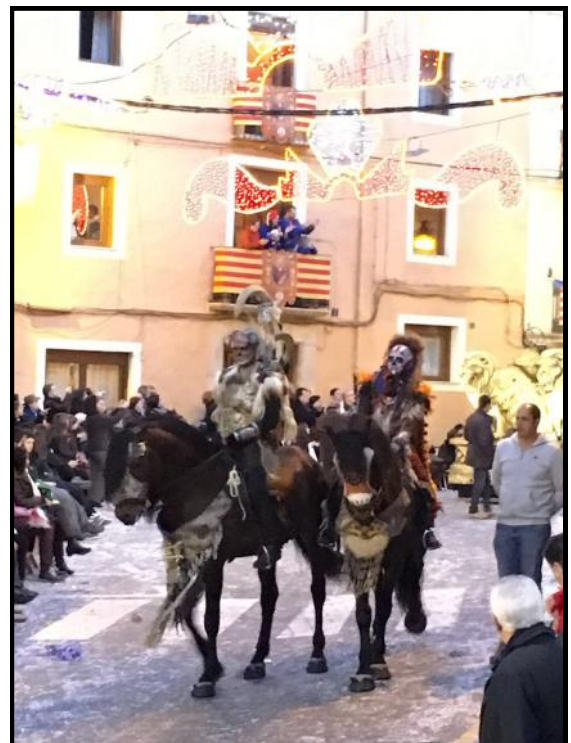
Imatge de l'Entrada del bàndol cristià