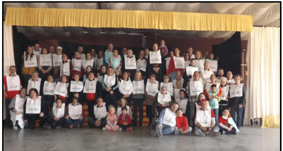
Foto de grup del Al·leridís i familiars que van gaudir de la calçotada

També van aprofitar l'ocasió, com no, per fer unes "filaetes" i assajar.