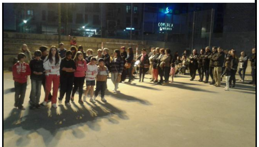
Grans i petits assajant a la pista de la Panera

Al acabar els festers i festeres van poder sopar a preus populars amb entrepans i begudes preparats pels companys de la comissió d'intendència.