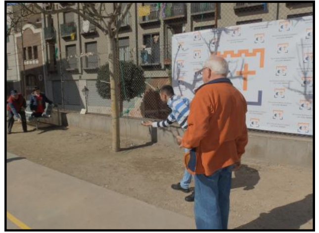
Jocs per grans i petits