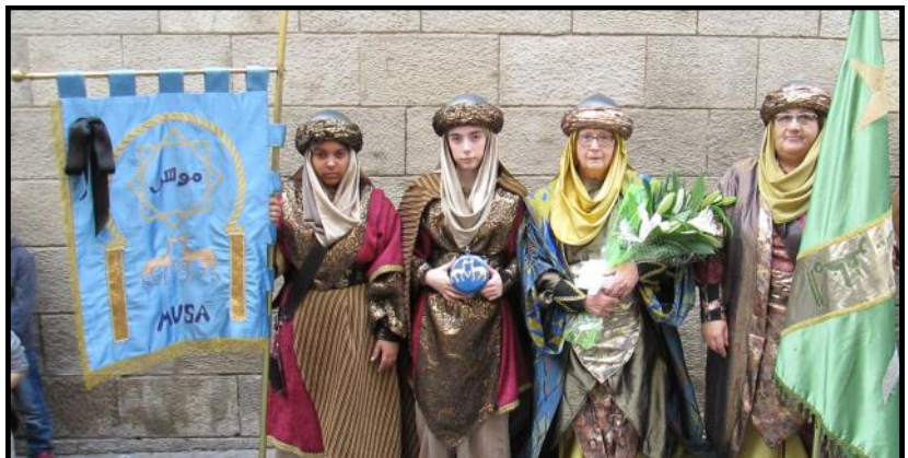
Els càrrecs de les comparses dels Musa i dels Urgellencs