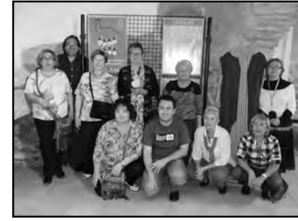
| EXPOSICIÓ A ANGLESOLA