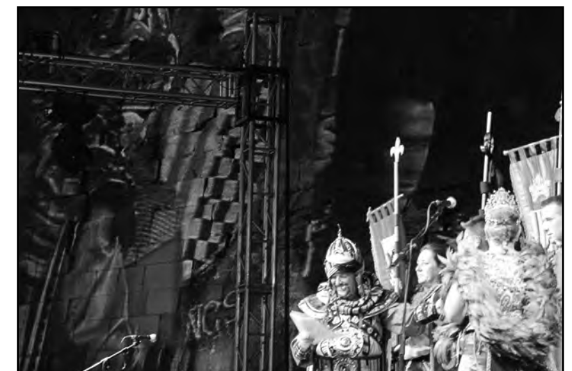
CARME TORRES ÉS L'AUTORA DE LA FOTOGRAFIA GUANYADORA

Així ho va decidir el jurat format per un membre de cadascuna de les comparses i un expert en fotografia que van triar entre una gran quantitat de fotografies originals. Les millors fotografies presentades, juntament amb les guanyadores, formaran part d'una exposició retrospectiva.