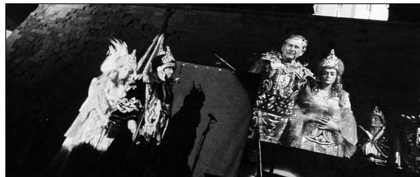
EL CAID YUSUF I BERNAT I D'ANGLESOLA DURANT LA BATALLA PEL DOMINI DE LLEIDA

respectivament. Per la tarda, i després d'un dinar de germanor al pavelló de vidre dels Camps Elisis on no hi va faltar l'ambientació musical de les bandes, les comparses es van aplegar a la Porta del Lleó de la Seu Vella des d'on es va iniciar l'Entrada a la ciutat. Una espectacular desfilada de gala que va reunir un seguici amb un miler de persones entre festers, dansaires, músics i altres artistes... Un espectacle impulsat per les comparses que ostentaven enguany les capitaniaes (Anglesola i Banu-Hud). L'esdeveniment va ser seguit per un nombrós públic al llarg de tot el recorregut. Uns espectadors que van poder, previ lloguer d'un seient, presenciar la desfilada còmodament des de l'avinguda de Blondel.