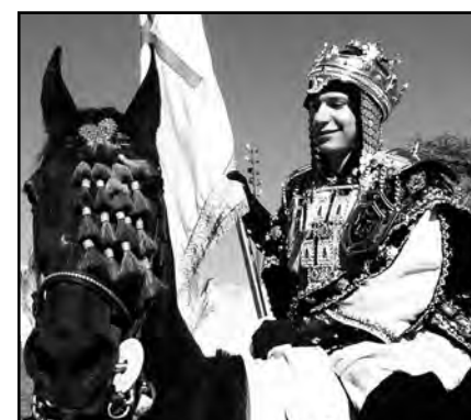
ABANDERAT CRISTIÀ

L'espectacularitat va ser la tònica de l'Entrada de Gala a la ciutat del diumenge 15 de maig. Les comparses es van aplegar a la porta del Lleó de la Seu Vella per iniciar l'Entrada a la ciutat, una fantàstica desfilada que va reunir un miler de persones entre festers, dansaires, músics i altres artistes per part de les comparses que ostenten enguany les capitànies (els Anglesola i els Banu-Hud). L'espectacle va ser seguit per un nombrós públic que podia llogar cadires i presenciar la desfilada còmodament des de l'avinguda de Blondel.