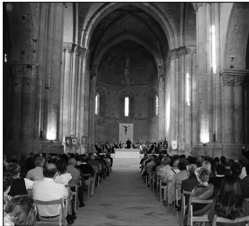
UN PÚBLIC MOLT NOMBRÓS VA ASSISTIR AL CONCERT