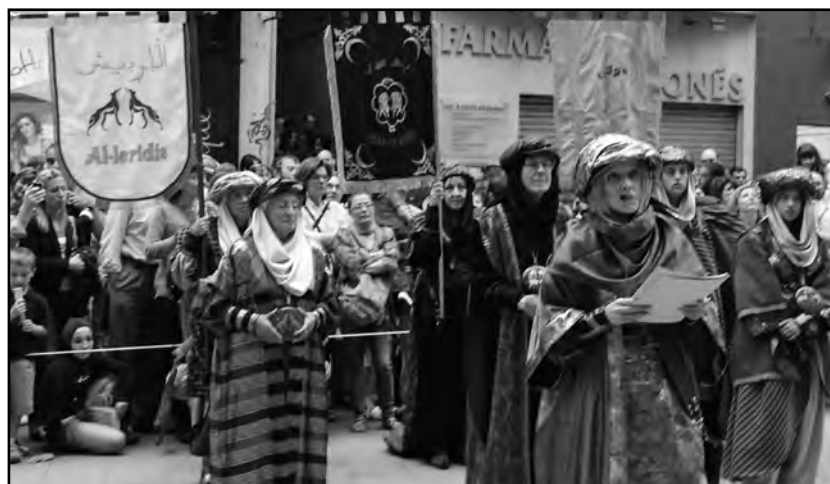
l'AMBAIXADORA MORA DAVANT EL PALAU DE LA PAERIA

Ambaixades, assaig infantil, esmorzar i berenar popular omplen el primer dia de festa