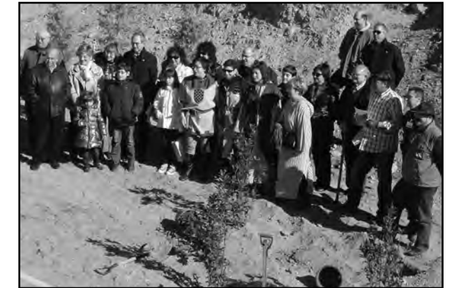
LA PLANTADA ES VA FER EL 28 DE FEBRER

Col·laboració amb el Turó de la Seu Vella