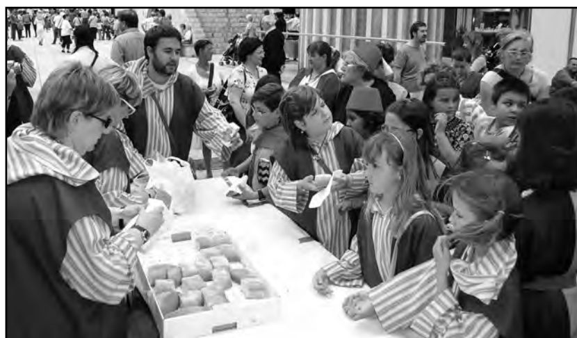
ELS PETITS FESTERS VAN GAUDIR AMB UN BERENAR

La recreació de les Ambaixades va ser, sens dubte, el plat fort de la primera jornada de la XVI Festa de Moros i Cristians de Lleida que va començar amb la celebració d'un esmorzar a la plaça Sant Joan. L'activitat festera es va reprendre a primera hora de la tarda quan els infants de la festa van assajar la seva Entrada a la ciutat del diumenge i després es va celebrar un berenar popular.