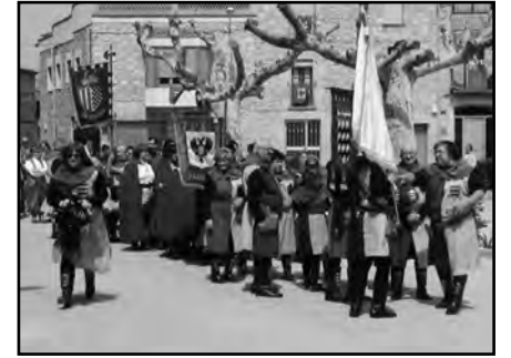
| DESFILADA A CIUTADILLA