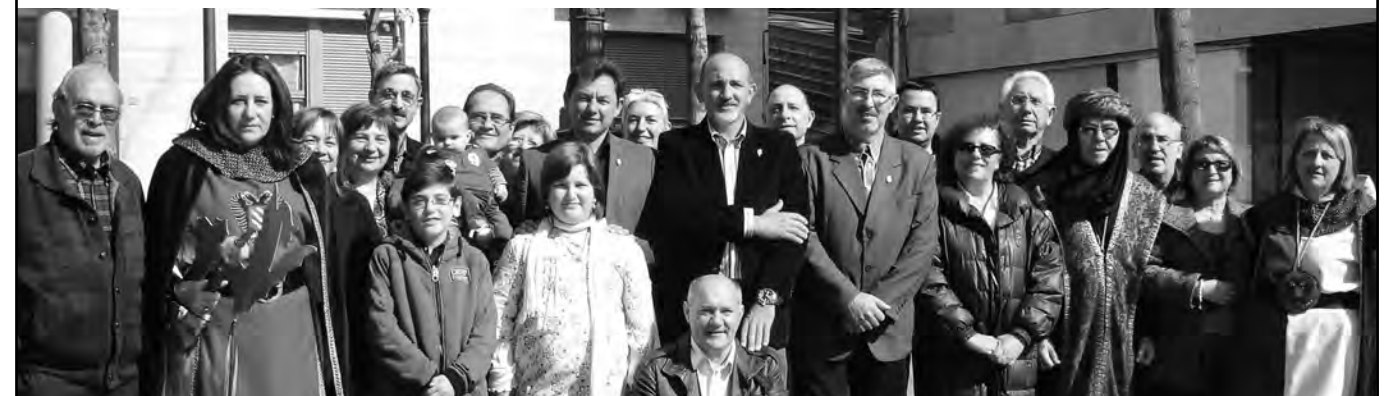
| FOTO DE FAMÍLIA EN FINALITZAR EL CURS