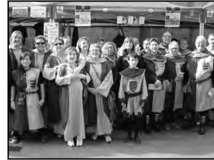
| DIADA DE CULTURA POPULAR A LLEIDA