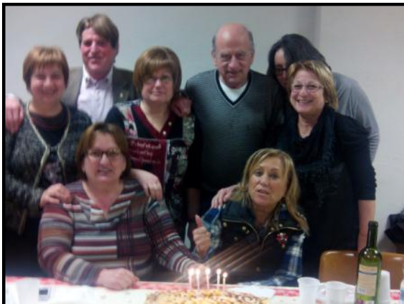
Els Pallaresos celebrant l'aniversari dels seus companys

A més a més i seguint les recomanacions de la Junta Directiva de la Associació aquest any s'han constituït com a entitat associativa.