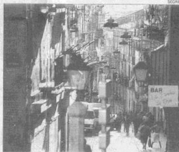
La calle Cavallers, dispuesta a animar las Fiestas de Maig.

La intención de los vecinos es "estar en condiciones de celebrar los primeros desfiles para las Fiestas de Maig y consolidar gradualmente la tradi-