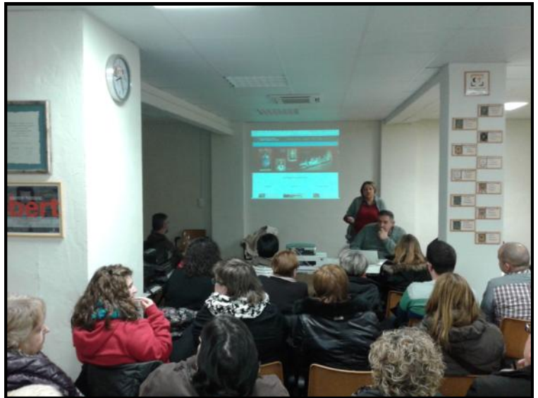
Festers i públic assistent a l'acte de presentació de la web miclleida.org

El web ha estat modificat per l'empresa Missatges i s'ha fet de manera que diferents festers puguin tenir accés al seu manteniment introduint totes les novetats i activitats relacionades amb l'Associació i la Festa.