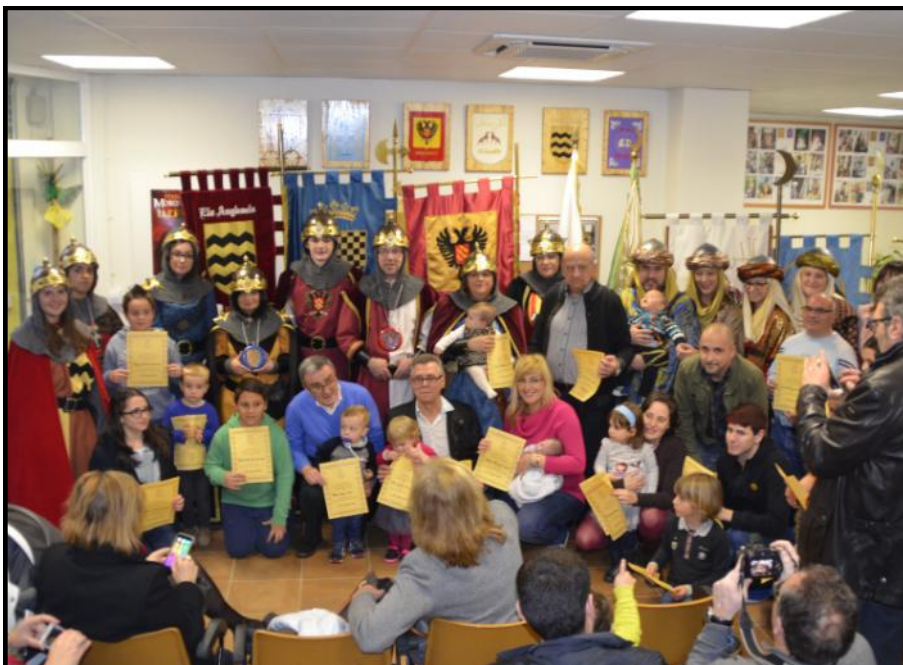
Foto de grup amb els nous membres de la Festa