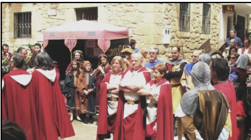
Membres de les comparses mores i cristianes desfilant pels carrers d'El Vilosell

En acabar van poder gaudir d'un dinar de germanor amb tots els veïns.