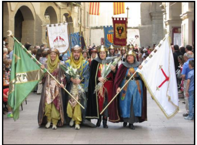
Capitans i Abanderats als porxos de la plaça Sant Joan