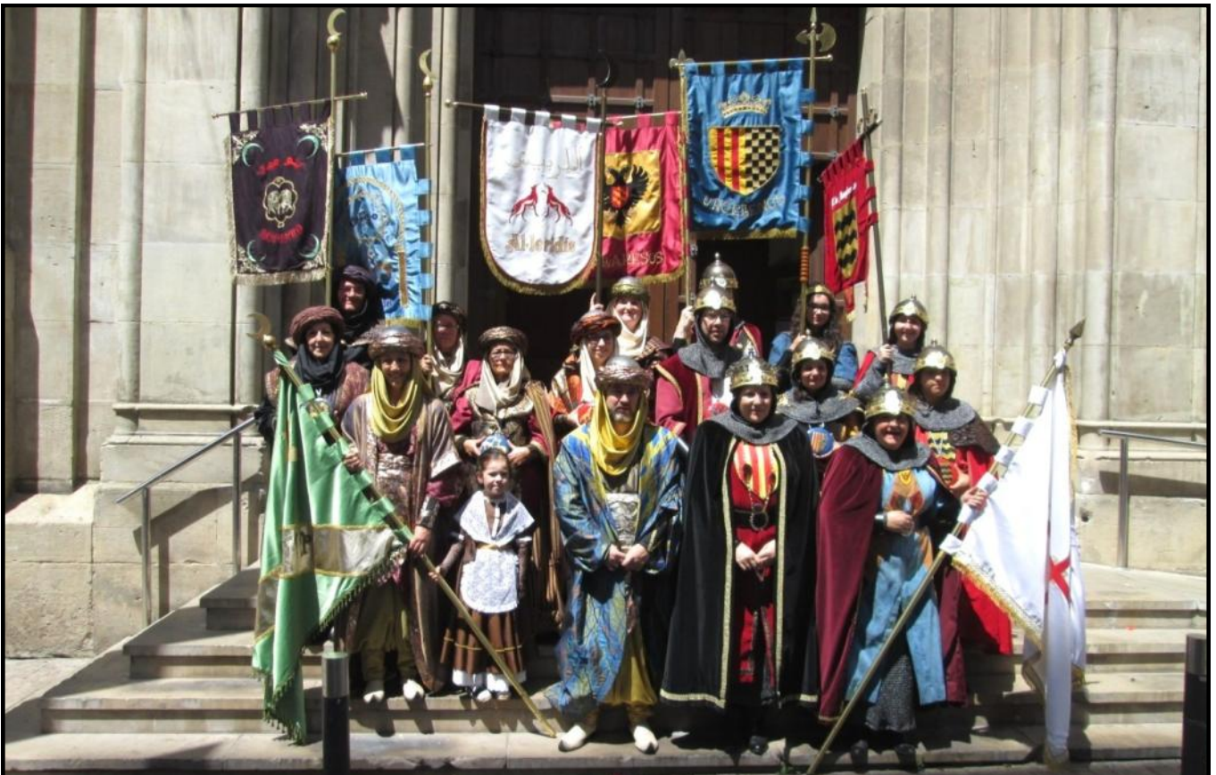
Foto de grup de tots els càrrecs a les escales de l'església de Sant Joan

L'ofrena, inclosa al programa de Festes de la ciutat, va ser l'inici per l'Associació, de tota la sèrie d'actes que es van dur a terme durant el cap de setmana fester.