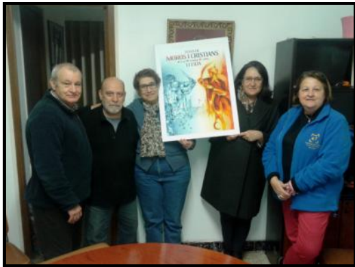
Jurat del XIX Concurs de Cartells de la Festa