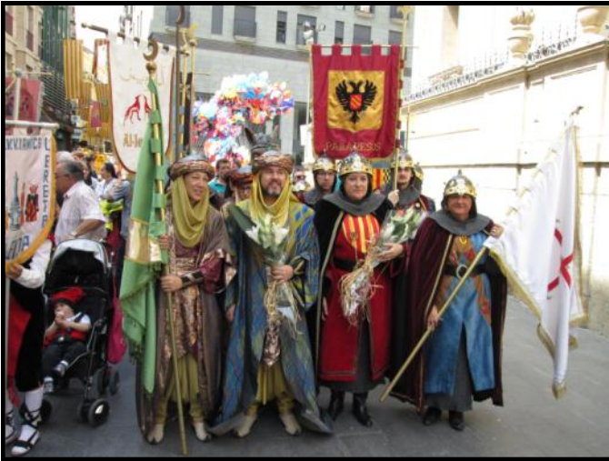
Capitans i Abanderats a la plaça de la Catedral