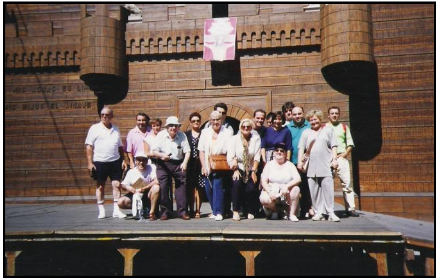
Viatge de membres de l'Associació de veïns del carrer Cavallers a Ontinyent l'agost de 1.995