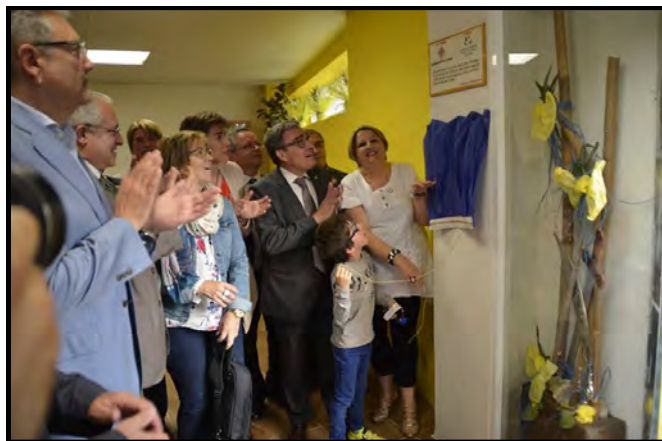
El paer en cap fa la descoberta de la placa commemorativa

També va agrair a tots els festers i festeres i als membres de l'associació la seva contribució a la creació "d'un espectacle global de Lleida" on la plàstica de les desfilades i els vestits dels diferents bàndols, juntament amb la música, fan que la celebració produeixi imatges úniques de la ciutat.