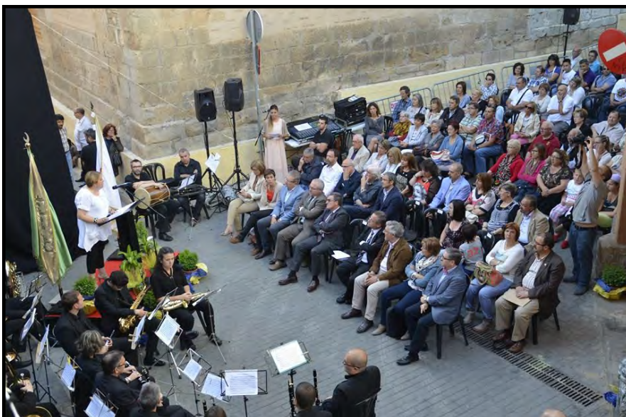
Autoritats i públic assistent a l'acte d'inauguració