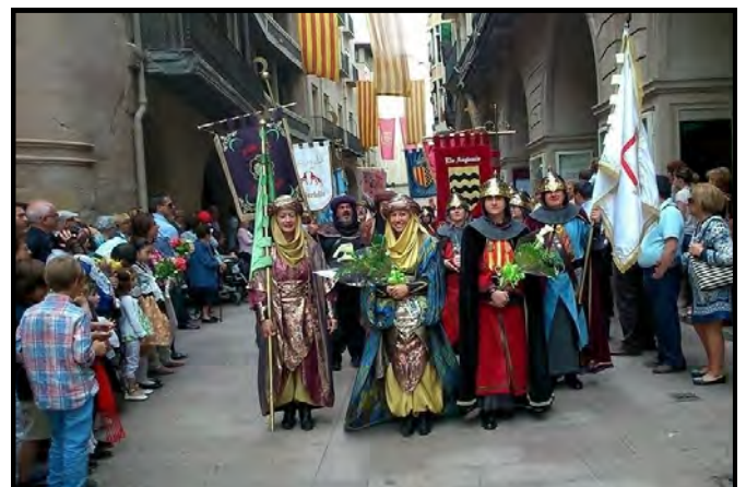
La Comtessa i la Saïda encapçalen el seguici de l'Associació