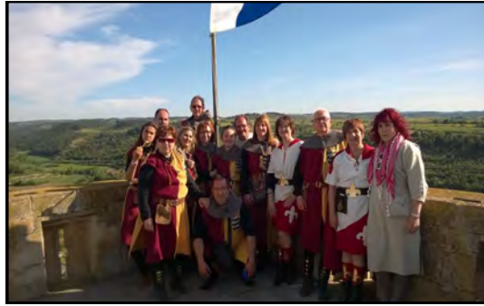
Festers desplaçats a Ciutadilla per participar a la desfilada.