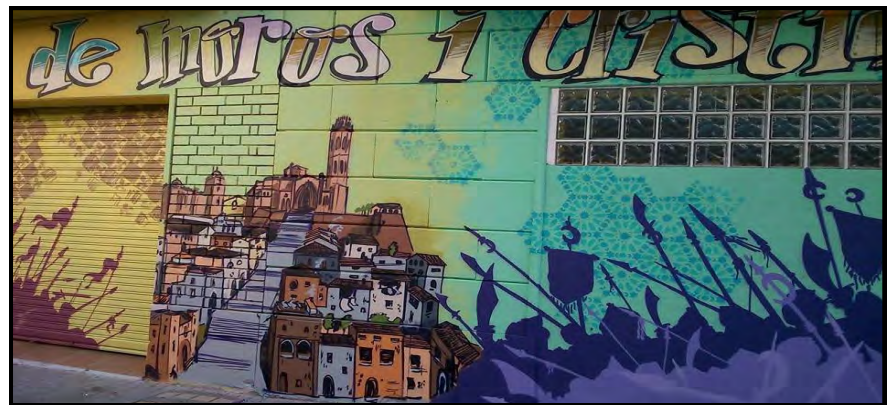
Detall del grafiti de la façana del nou local social, obra de Joan Pallé Argilés