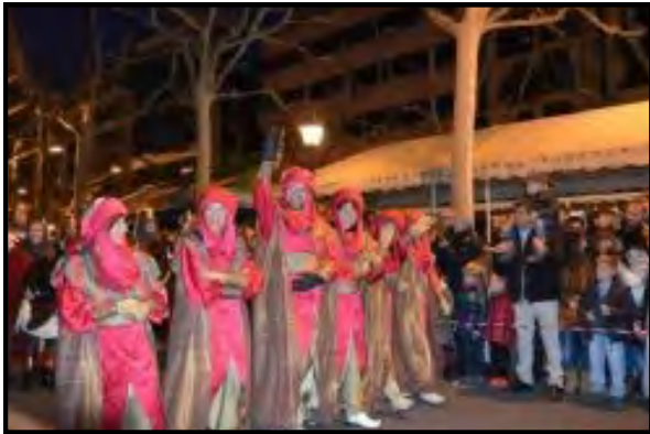
Festers al seguici dels Reixos