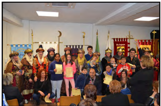
Foto de grup dels nous socis al local del carrer Panera 1.