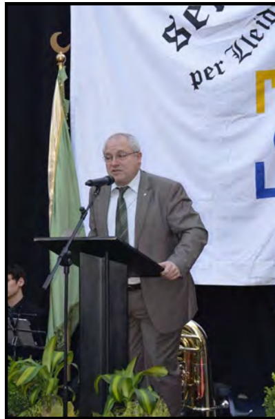
El director general de Cultura Popular