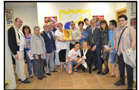
Els urgellencs fent entrega de l'escut de comparsa