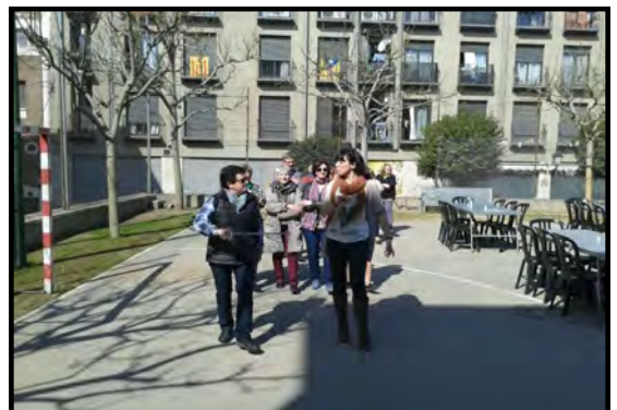
Festers assajant de cap d'esquadra.

Aquesta iniciativa, que va ser molt ben acollida per tothom, probablement es repetirà en properes edicions de la Festa.