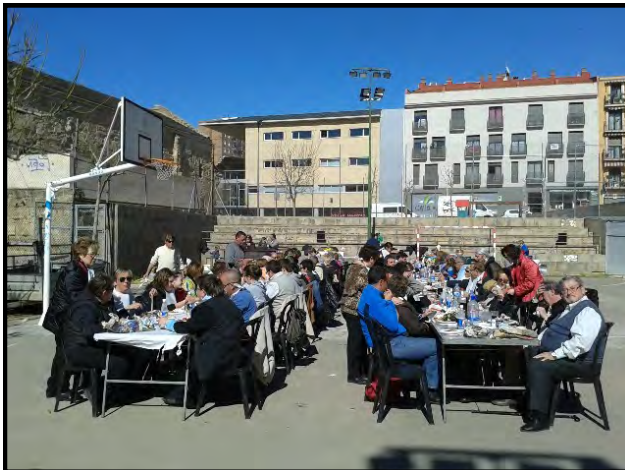
Assistents a la II Calçotada Popular de l'Associació.