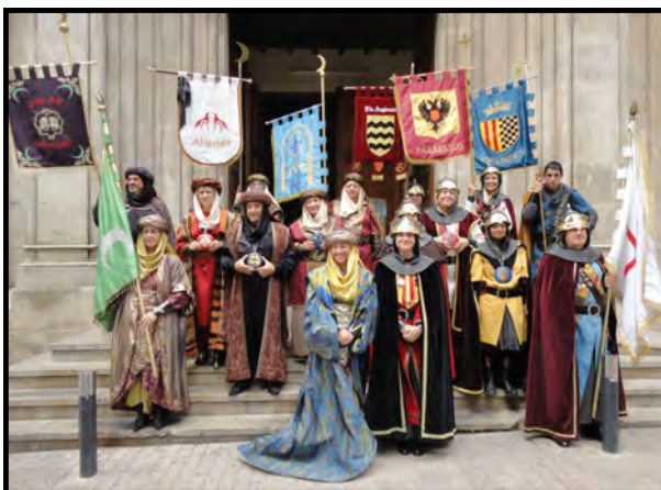
Els càrrecs de la Festa a l'església de Sant Joan

L'ofrena, inclosa al programa de Festes de la ciutat, va ser l'inici per l'Associació, de tota la sèrie d'actes que es van dur a terme durant el cap de setmana fester.