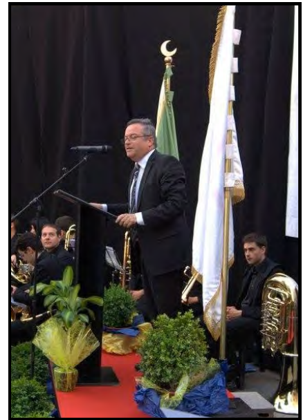
El vicepresident de la Diputació de Lleida